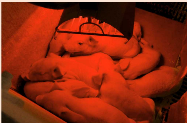
ヒーターと床暖房で保温されている子豚。 服を着ていないので人間以上に温度管理が重要です。