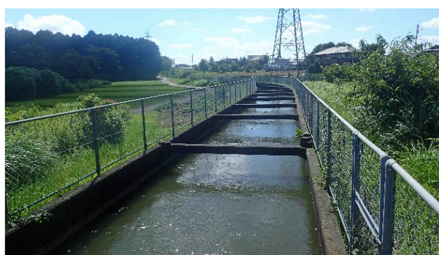
学園都市の農業水路ネットワーク