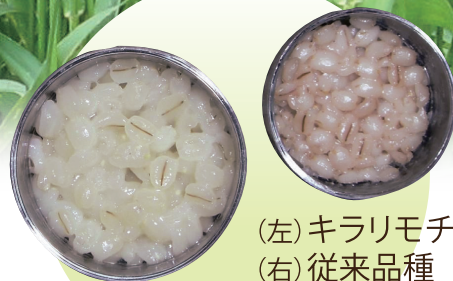
(左) キラリモチ (右) 従来品種 ※炊飯後18時間