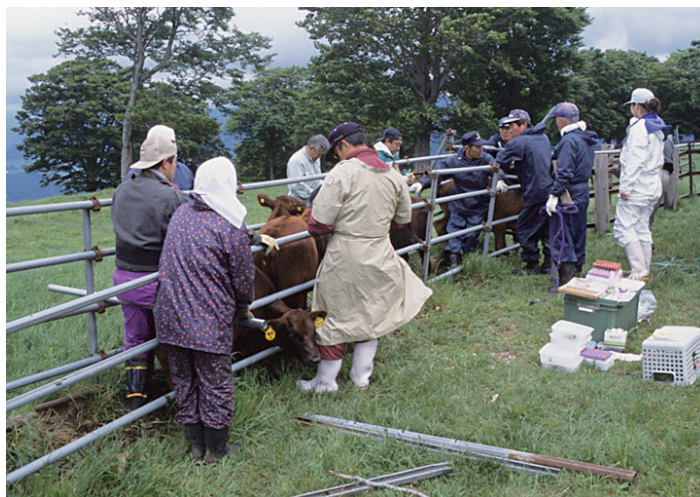
写真5. 放牧衛生検査 (左：青森県, 右：秋田県)

研究所の全国 341 ヶ所の放牧場調査 13) での小型ピロプラズマ病以外の上位疾病は、乳用牛では皮膚真菌症、趾間腐爛、繁殖障害、肉用牛では下痢、外傷、趾間腐爛、繁殖障害であったことから、近年の 10 年程度において疾病そのものに大きな変化はなかったと考えられる。