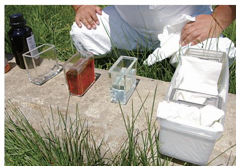
写真7. 放牧衛生検査（現場での迅速な検査を可能にする工夫や自作器具：秋田県）