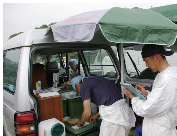
写真6. 放牧衛生検査（採血現場でヘマトクリット値測定と血液塗抹標本の鏡検 左：晴天時，右：雨天時 秋田県）