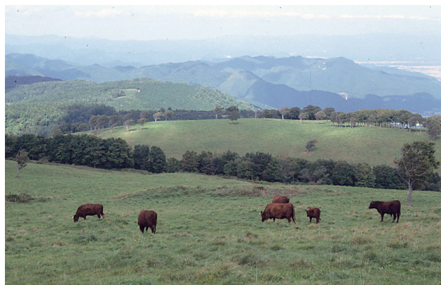
写真 1. 公共牧場での放牧（日本短角種の親子放牧：秋田県）

図に東北地方における最近 15 年余の公共牧場数、放牧頭数の推移を示した。牧場数、放牧頭数ともに減少傾向にあり、特に平成 10 年以降の減少、とりわけ肉用牛における放牧頭数の減少が顕著である。これらの原因としては、高齢化などによる牛飼養農家戸数や飼養頭数の減少、増体量や繁殖成績の不振・疾病等による放牧の敬遠、人工授精や受精卵移植あるいは周年預託や牧場までの牛の運搬といった農家側のニーズが満たされていない等によるものが挙げられる 4) 8) 。さらに、平成 23 年 3 月 11 日に起きた東日本大震災による福島第一原子力発電所事故に伴う放牧場の放射能汚染の影響で、放牧を中止した牧場があることも放牧頭数減少の一因となっている。