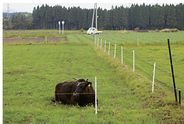
写真2. 水田，畑の跡地を利用した小規模放牧（青森県）

万 ha となり、耕地面積の1割にも迫る勢いである 6) 。東北地方においては6県で計7.1万 ha（平成17年）と全国の2割弱を有している。農林水産省は急増する耕作放棄地対策の一つとして放牧利用を推奨しており、山口県が発祥とされる耕作放棄地への放牧は現在、関東や東北地方にまで広がりをみせている（写真2）。その結果、繁殖牛経営における生産コスト低減と増頭、景観の好転、獣害の低減、家畜とのふれあい等の成果が報告されている 2) 。小規模放牧は近年、電気柵等の使用機材の入手が容易になったことや各種マニュアルが整備されたこと、また新規参入者にとっても比較的容易に実施が可能であることなどから今後東北地方においても増加するものと考えられる。