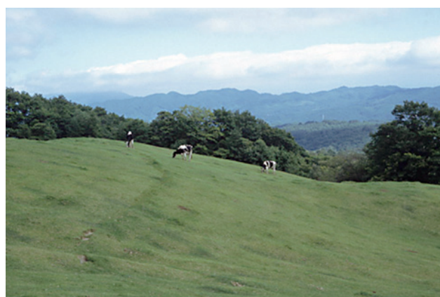
写真4. 山地酪農（岩手県）

における林間放牧の一例を示した。日本短角種の親子放牧で、広大な山林を無柵で放牧されていたが現在は姿を消した。