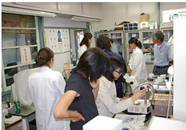
写真 8. 東北地域放牧衛生担当者会議における実習 (左：家畜害虫，血液塗抹標本の観察 右上：アブトラップの説明 右下：サシバエの薬剤耐性簡易検査のための器具作り)

較的経験の浅い若手からベテランまで多様であり，参加者間での技術や情報の伝達も積極的に行われていた。