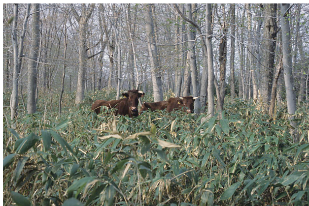
写真3. 林間放牧（無柵で放牧：秋田県）

国土の約7割が森林で覆われているわが国の中で、東北地方はとりわけ森林が豊富な地域である。この林地の下草を飼料として利用するいわゆる林間放牧は、林業および畜産業からみた合理性からかつては東北地方においても実施されていた。しかし、看視や捕獲など日常管理に労力がかかることや育成牛の発育の点などの問題から現在はほとんどみられなくなった 14) 。写真3に秋田県に