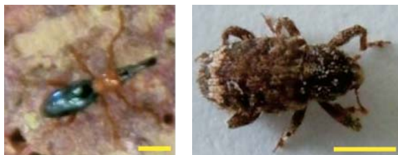
写真1 アリモドキゾウムシ(左)とイモゾウムシ(右) 黄色い線は、それぞれの写真中で1mmを示します。

環境にやさしい生物農薬で特に注目されるのが、防除を行う地域にいる生物、「在来天敵」です。当センターの線虫学者が沖縄で、前記のゾウムシをよく殺す線虫（昆虫病原性線虫）を見つけました。これらの線虫は地中で生活するので、地中にあるゾウムシ防除は得意のほうです。実際、その線虫をサツマイモ畑に撒きますと、線虫は植物体内のゾウムシ幼虫にたどり着き、それを殺す能力があることが明らかとなりました。このような芸当のできる資材は、化学農薬も含め、生物農薬でも極僅かです。この在来天敵で畑のゾウムシを減らし、ゾウムシ被害のないイモの生産を増加させることができました（図1）。