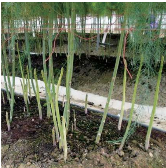
写真 沖縄での11月のアスパラガスの萌芽状況 九州では11月はほとんど萌芽しません。