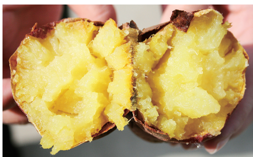
写真1 形と大きさの揃った「べにはるか」(上) とその焼きいも(下)