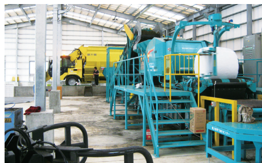
写真2 徳之島町のTMRセンター