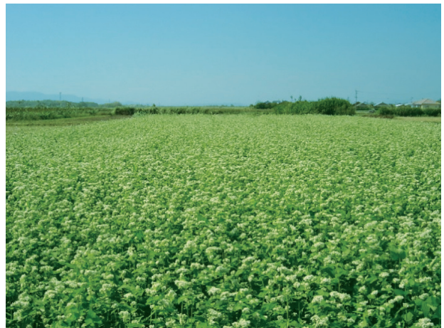
写真2 開花期の「さちいずみ」 (鹿児島県内の生産者圃場)