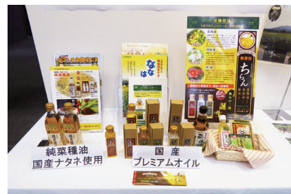
「まるひめ」と「ななはるか」のプレミアムオイル