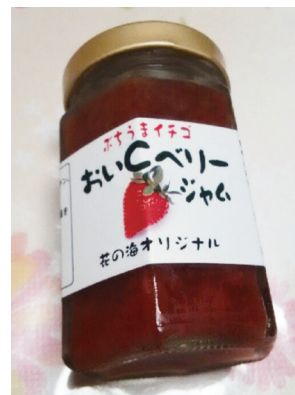
写真 生果だけではなく、加工品への利用も進められている「おいCベリー」