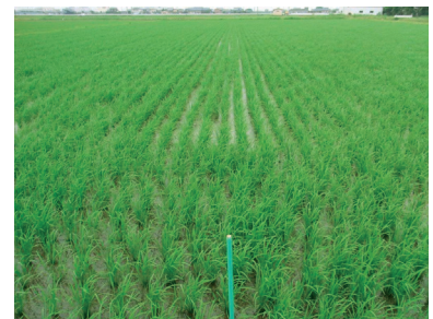
写真4 直播1ヶ月後の水稲