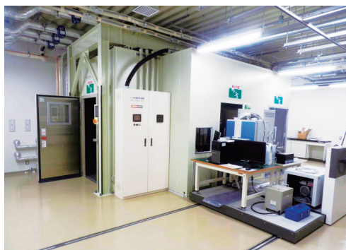
写真3 プラズマライト人工気象室と質量分析計