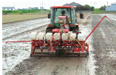
写真3 ショットガン直播機による播種 (佐賀県上峰町)