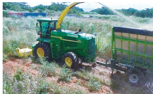
写真3 飼料用サトウキビの収穫