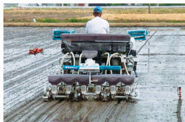
写真2 多目的田植機による播種 (福岡県筑後市)