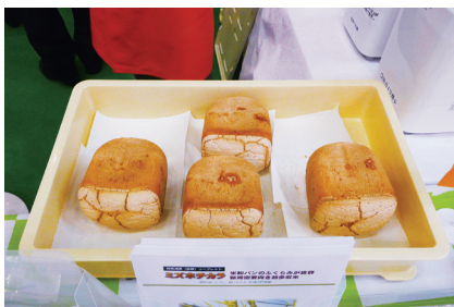
「ミズホチカラ」のグルテンフリー米粉パン