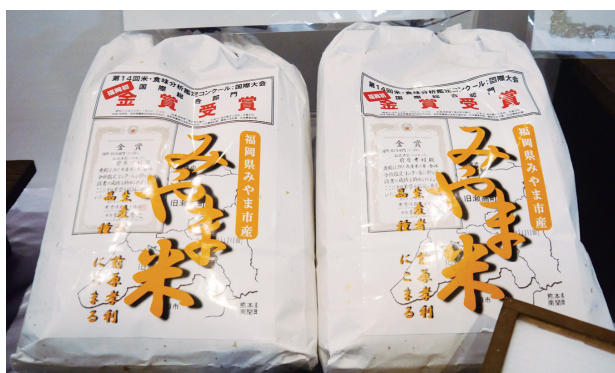
写真 福岡県みやま市で販売されている金賞受賞の「にこまる」

「にこまる」は2005年に長崎県で奨励品種に採用され、普及が始まりました。その後、大分県、静岡県、愛媛県、高知県で奨励品種や認定品種に採用され、2014年の普及面積は10,000haに近いと推定されます。表1の上段が品種登録時の特性データにあたり、ヒノヒカリに比べ優れた玄米品質を持ち、やや多収です。食味はヒノヒカリと差がありません。表1の下段が最近5ヶ年のデータで、「にこまる」の出穂期は登録時に比べやや遅くなっています。一方、近年頻発する高温年の影響もあり、登熟期間が短縮されています。そのため、最近の収量は登録前に及びません。しかし、ヒノヒカリの方が高温登熟の影響がよりシビアなため、「にこまる」の収量はヒノヒカリ比117%とかなりの多収になっています。