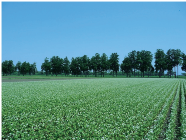
写真1 開花期の「春のいぶき」 (合志本所の試験圃場)