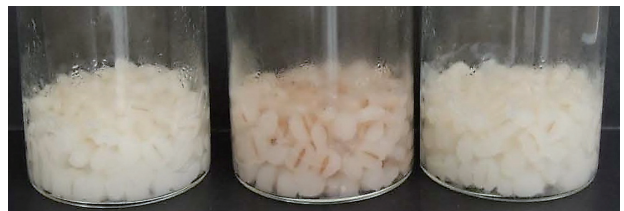
写真2 穂発芽耐性の強い次世代の無変色有望系統「西海皮76号」の炊飯麦粒