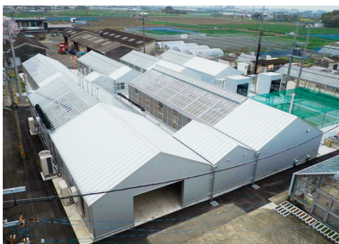
写真2 世代促進温室群