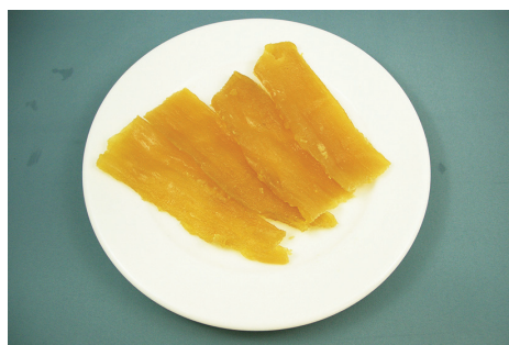
写真2 食味と食感の良い「べにはるか」の干しいも