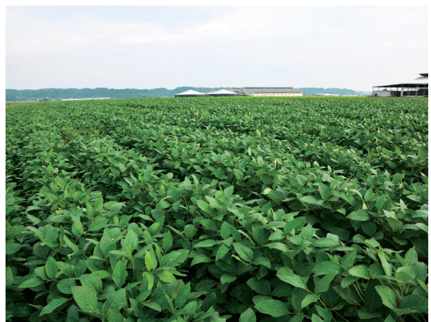
写真2 山鹿市鹿本町「すずかれん」展示圃場の様子 (2014年9月22日)