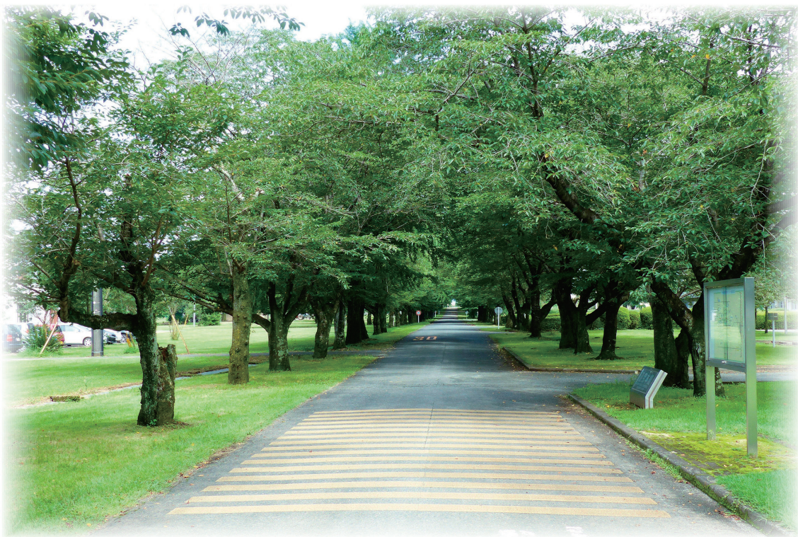
初夏の桜並木（合志本所）