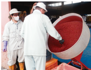
写真1 べんがらモリブデンの被覆作業 (右の上はべんがらモリブデン被覆種子)