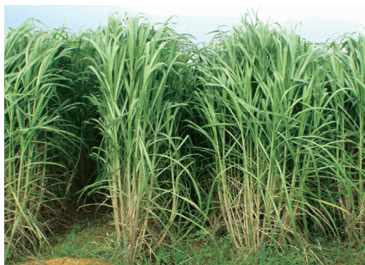
写真1 飼料用サトウキビ「しまのうしえ」