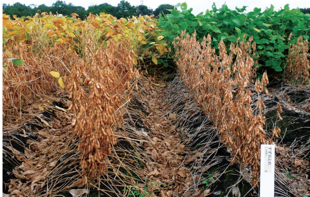
写真1 九州沖縄農業研究センター育種圃場での成熟期の様子 左:「すずかれん」、右:「すずおとめ」