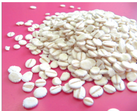
写真1 「白妙二条」の押し麦