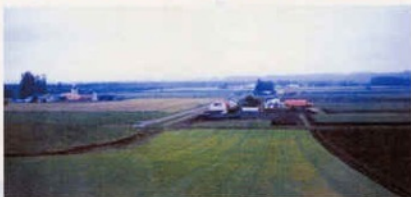
大規模な畑作経営と酪農経営が混在する十勝平野