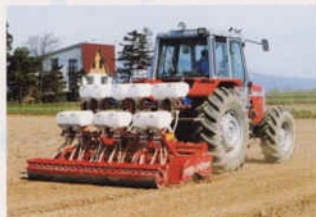
大区画水田における水稲の乾田直播作業

水 稲栽培では、ふつう苗を育てて田植を行いますが、田んぼに直に種を播く方法が直播です。直播には乾田直播とたん水直播があります。