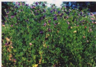
アルファルファ新品種「マキワカバ」

北海道の寒さに負けない新品種の開発が長い間求められていました。そのため新しく作られたのが、雪に強い「マキワカバ」と寒さに強い「ヒサワカバ」です。この2つの品種は収穫量も多く、家畜の良い飼料として期待されています。また、さらに寒さに強い新品種「ハルワカバ」が育成されました。