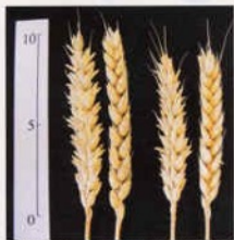
左：キタノカオリ 右：ホクシン

国 内で作られる小麦の多くが、うどん用の品種です。パンやラーメンにむいた品種は少ないため、その多くを輸入に頼っています。