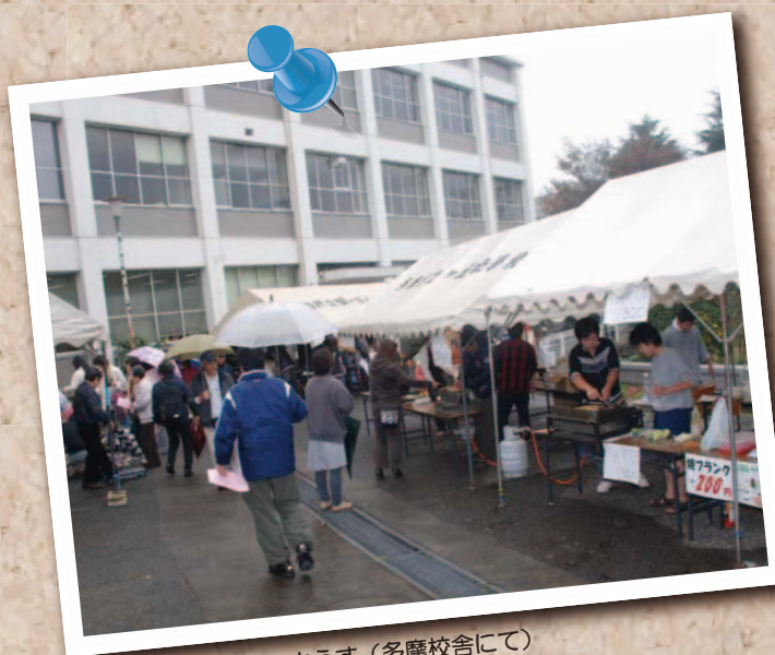
△ 昨年の豊饒祭のようす（多摩校舎にて）