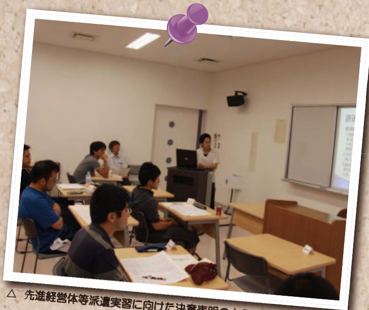
△ 先進経営体等派遣実習に向けた決意表明のようす

つくばの学生の实習は今年で2回目を迎えますが、今年は、事前の決意表明に加えて、昨年実習を経験した2年生との意見交換を行い、準備万端整えてそれぞれの派遣先へ向かいました。決意表明では、各学生は約5分間の持ち時間でプレゼンテーションを行い、実習先の概要説明や実習への意気込みを発表しました。