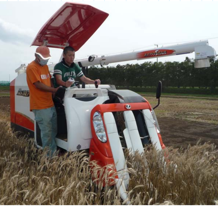
△ 農作業実習の様子