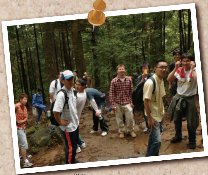
△ 登山に汗を流す学生

毎日授業に追われる学生にとっては、またとないリフレッシュの機会となったようです。