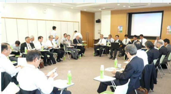
△ 道府県農大等との連携を促進するための会議の様子（平成20年10月 農業者大学にて）

1942年 徳島県生まれ 1965年 京都大学農学部農学科卒業 1970年 同大学院農学研究科博士課程修了 1989年 同大教授 2006年 定年退職 同大名誉教授 2008年 農業者大学校長に就任 専攻は家畜育種学