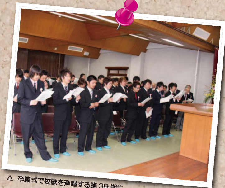
△ 卒業式で校歌を斉唱する第39期生