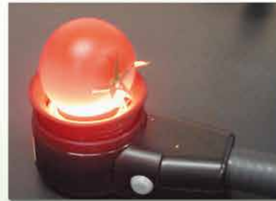
トマトに含まれるリコペン含量の 高精度非破壊計測

野菜茶業研究所は、野菜と茶の生産・流通・消費現場における緊急かつ重要な課題を解決するための実際的な研究に取り組んでいます。