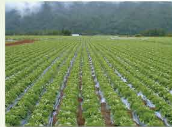
業務用野菜の低コスト安定技術の開発