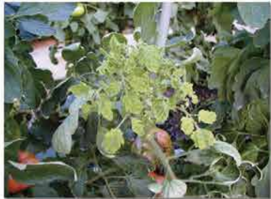
トマトの黄化葉巻病防除対策のマニュアル化