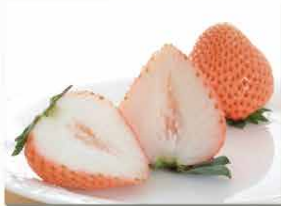
芳醇な香りと新しい風味のイチゴ新品種「桃薫」

野菜茶業研究所は、野菜と茶の多様性や食品としての特徴を活かして国産農作物の優位性を最大限に発揮させるための技術開発に取り組んでいます。