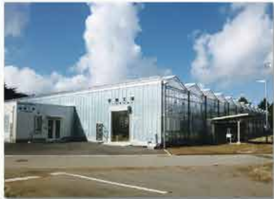
先進技術を体系化する 太陽光利用型植物工場

野菜茶業研究所は、野菜と茶の安定多収生産のために必要な省力低コスト安定多収生産と環境負荷低減を両立させるための技術開発に取り組んでいます。