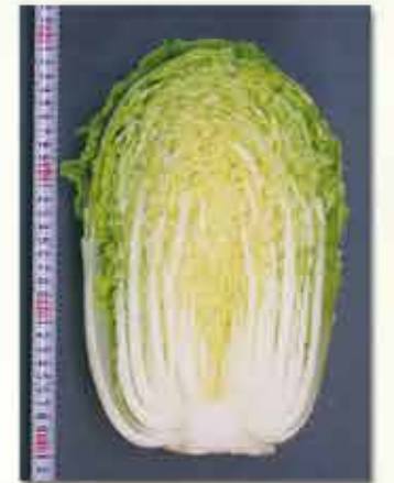
DNA マーカーを利用した根こぶ病強度 抵抗性ハクサイ F1 品種「あきめき」

野菜茶業研究所は、野菜と茶産業、ひいては日本農業の未来に向けた長期的な展望に基づく夢のある先導的・基盤的研究に取り組んでいます。