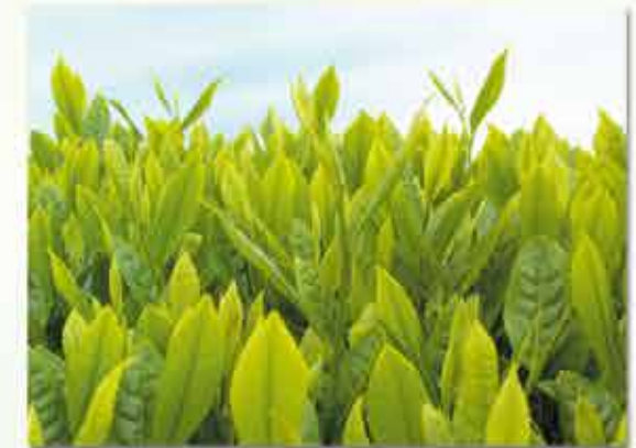
「べにふうき」緑茶による スギ花粉症の症状軽減