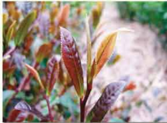
高アントシアニン含有チャ新品種「サンルーージュ」