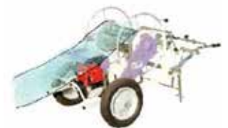
図3. 大面積用フィルム除去作業機の開発

これらの課題の解決により、中山間地域に限らず、土壌病害に困っている多くの地域で、化学農薬に頼らない環境保全的な防除技術が広く普及することが期待されます。