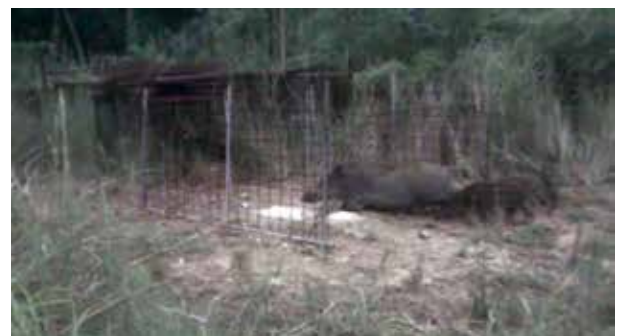
写真2 金網柵の隙間から侵入するイノシシ

では、侵入方法を学習したイノシシを防ぐことはできないのでしょうか？実は、今回の実験で侵入を経験し、しつこく柵を突破しようとしたイノシシも、適切に設置した柵へ侵入することはできませんでした。このことから、イノシシに金網柵の隙間から侵入されてしまった場合も、できる限り早期にその場所を発見し、補修したり適切に設置し直すことにより、イノシシの侵入を防止できることがわかりました。そのためにも、日頃から防護柵の見回りや点検をしっかりと行うことが重要となります。