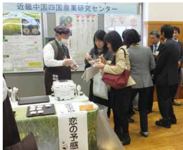
テイスティングタイムの一コマ