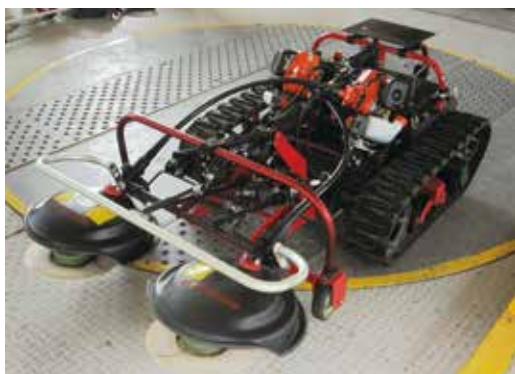
写真1 小型除草ロボット

小型除草ロボットは急傾斜地で利用するため、走行はクローラ式としています。動力は電動で、モータにより左右それぞれのクローラの駆動を行っています。作業を行う法面への移動は軽トラックを利用することを想定しているため、機体幅は100cmに収めています。走行速度は約0.4m/sで、機体は静止した状態で45度傾けても転倒しないことを確認しています。なお、走行の自動制御部を実装していないため、操作は無線による遠隔操作により行います。