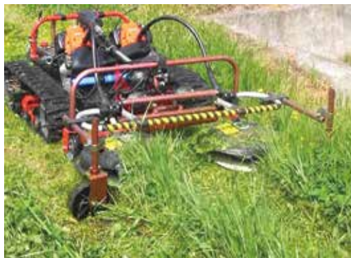
写真2 草刈り機間の刈残しの処理

今後、さらに作業の能率の向上や安全性などを向上させ、実用化に向けた研究を進めていきます。