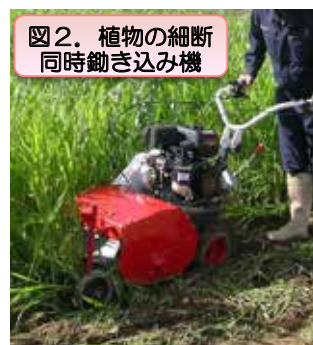
図2. 植物の細断同時鋤き込み機

現状の機械では植物の細断と鋤き込みを別々に行う必要がありますが、これを一度にできる機械を開発します（図2）。また、すでに開発されている、露地の大面積を簡単に被覆する方法をさらに改良するとともに、今後、大面積の被覆除去が簡単にできるフィルムの巻き取り除去機を開発します（図3）。