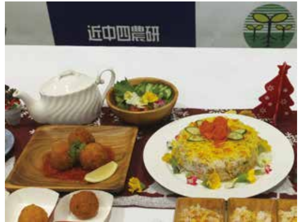
披露された創作料理