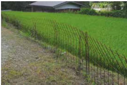
写真1 イノシシ侵入防止金網柵

さまざまな地域でイノシシが田んぼや畑に侵入し、農作物を食べる被害が発生しています。その被害を防止するため、イノシシ侵入防止効果の高い金網柵(ワイヤーメッシュ柵、写真1)を農地や集落の周囲に設置する対策が行われています。