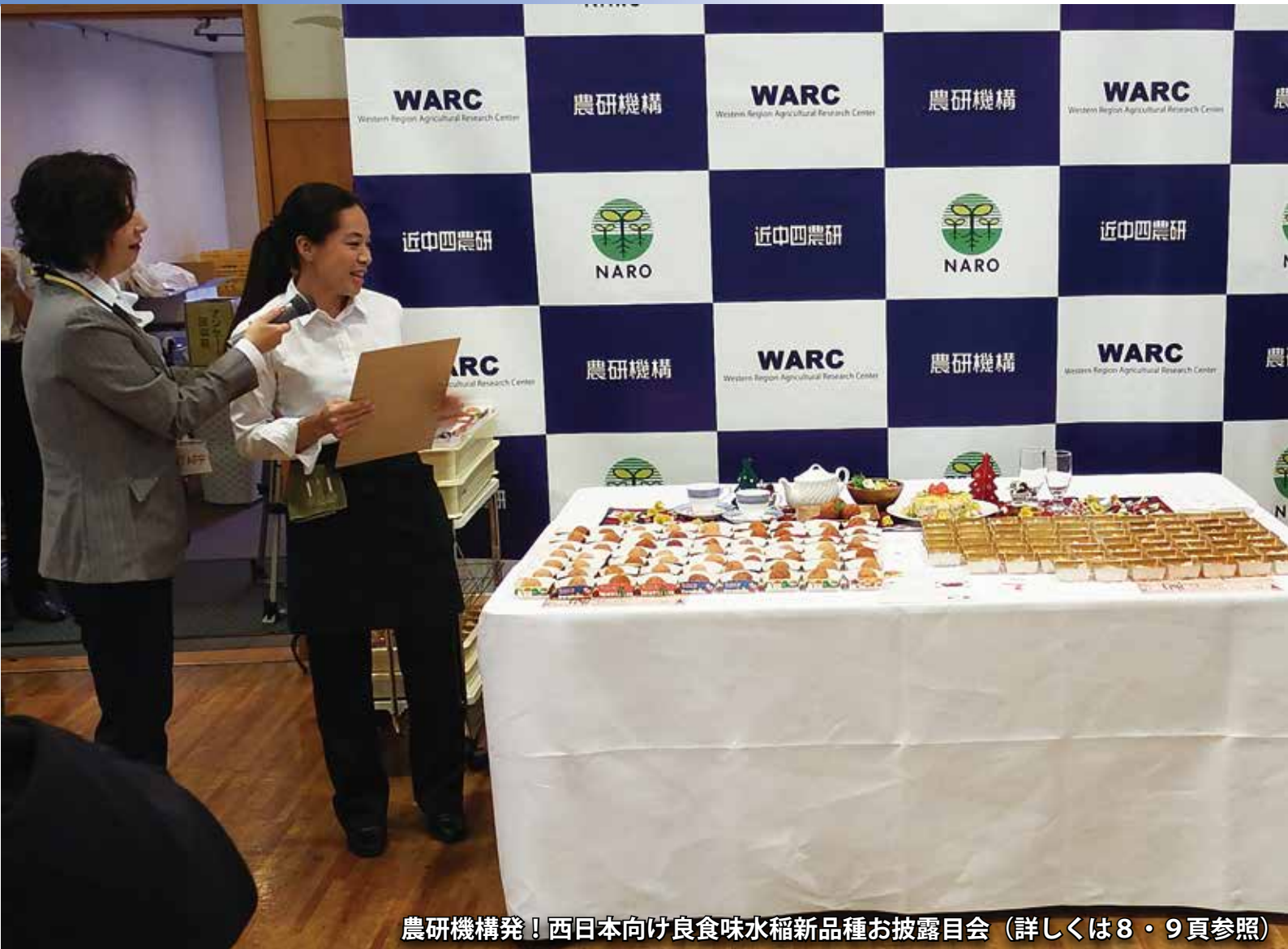
農研機構発！西日本向け良食味水稻新品種お披露目会（詳しくは8・9頁参照）