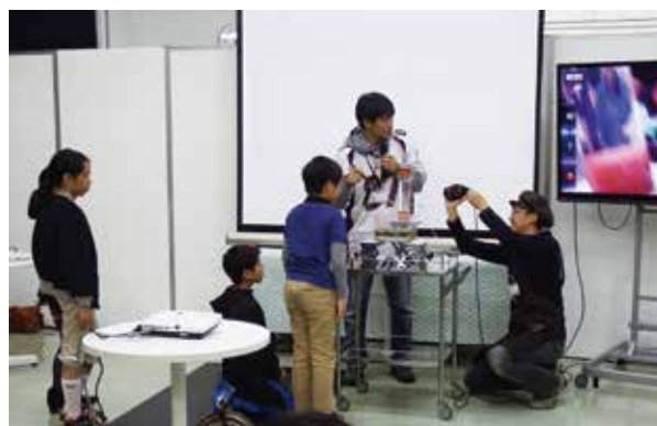
子供たちと一緒にミニチュアフォアス実演中