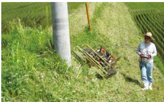
写真3 急傾斜法面での作業風景