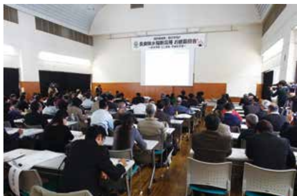
アピールタイム風景

クエスチョンタイムでは、各品種の栽培方法や種子の入手方法について質問する生産者の方などが後を絶えず、来