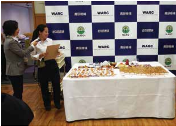
料理研究者による創作料理の披露

最後に、募集定員の都合上、多くの申し込みをお断りする状況になってしまいましたが、関係者、参加者ならびに多くの報道関係者の皆さまのお力添えにより、本お披露目