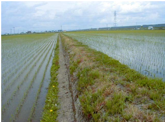
作目：穀類、水稲 作業：栽培管理、共通 目的：作業姿勢改善、圃場整備、作業安全 方法：畦畔の法面を削り、幅 30cm 程度の足場を造成。