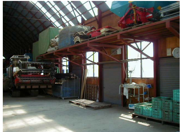
作目：共通 作業：圃場・施設管理 目的：施設整備 方法：資材、機械部品等の収納用棚を設置。