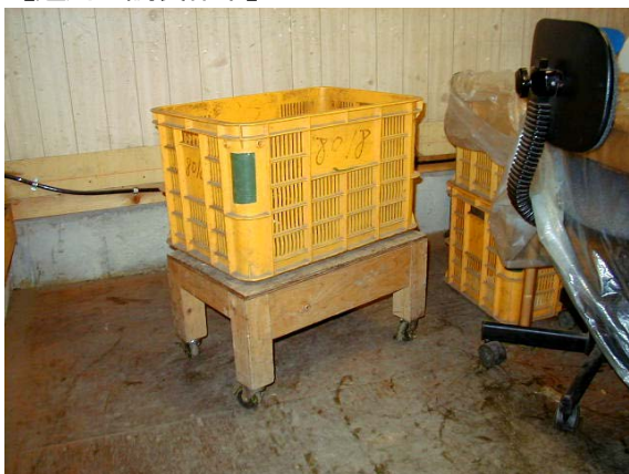
作目：ニラ 作業：選別・調製 目的：重量物負担軽減 方法：コンテナの台へキャスタを取り付けた。