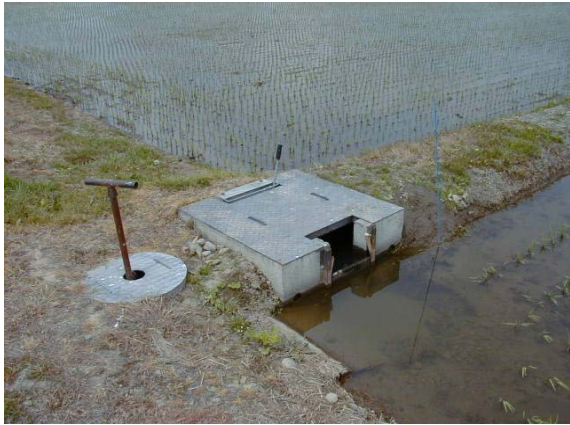
作目：穀類、水稲 作業：栽培管理 目的：効率化・省力化 方法：パイプライン灌がいを設置。