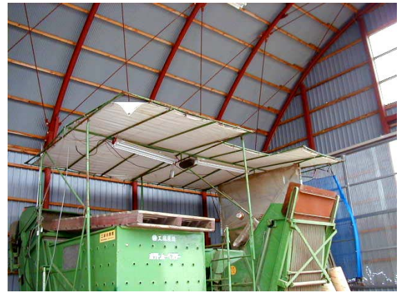
作目：馬鈴薯 作業：収穫 目的：温度調節、明るさ調節 方法：ポテトハーベスタへ日よけ、蛍光灯を装備。