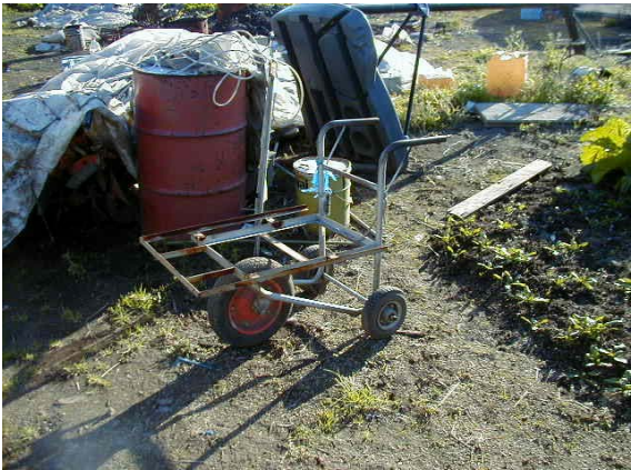
作目：野菜 作業：収穫、運搬 目的：重量物負担軽減 方法：1輪車の脚に車輪を付け3輪車を使用。平坦なところは3輪で押すだけで移動。凸凹なところは1輪で使用。