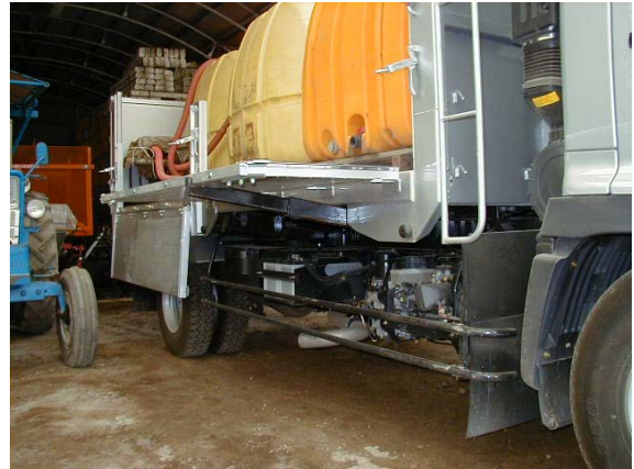
作目：共通 作業：共通 目的：効率化・省力化 方法：トラックのアオリ板を水平に支持する棒を製作。アオリ板を一時的に台として活用できる。