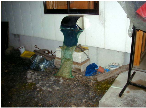
作目：ニラ 作業：選別・調製、廃棄物処理 目的：効率化・省力化、環境保全 方法：はかま取り機から排出される野菜クズを網袋へ回収。