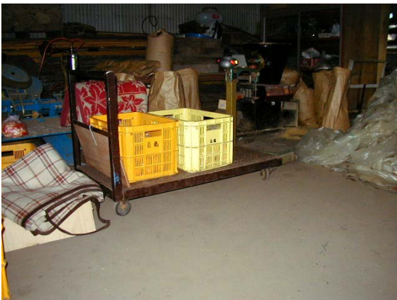
作目：共通 作業：運搬 目的：重量物負担軽減 方法：運搬台車を使用。