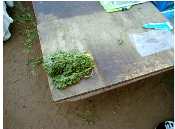
作目：春菊 作業：選別・調製 目的：効率化・省力化 方法：切り揃える長さの位置に線を引いた。