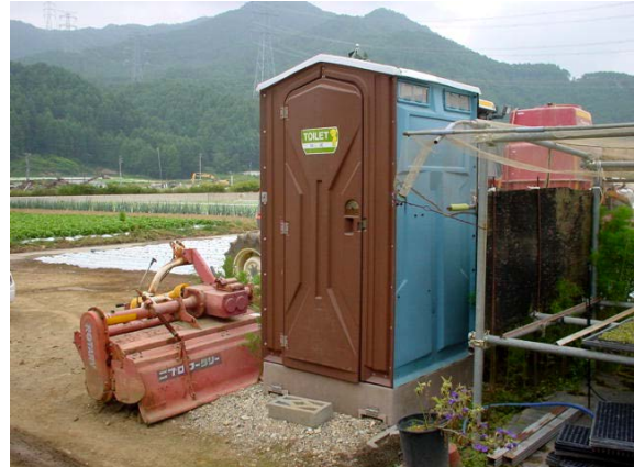
作目: 共通 作業: 共通 目的: 福利厚生 方法: 簡易トイレを圃場近辺に設置。