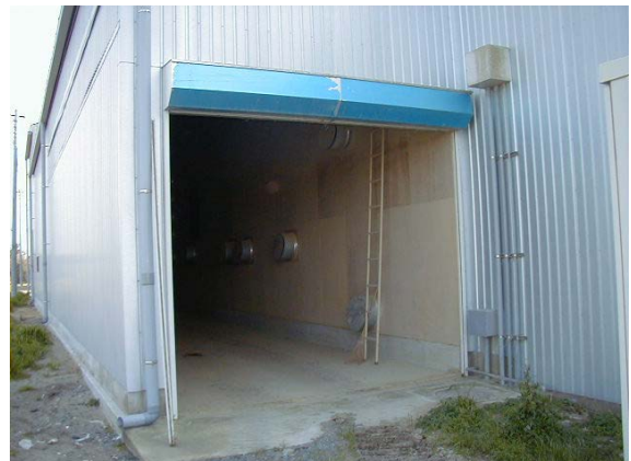
作目：共通 作業：共通 目的：効率化・省力化 方法：乾燥時期以外はもみ殻収納庫を機械格納庫や物置として活用。