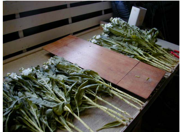
作目：花卉 作業：選別・調製 目的：効率化・省力化 方法：切り揃える長さの位置に線を引いて定規を製作した。