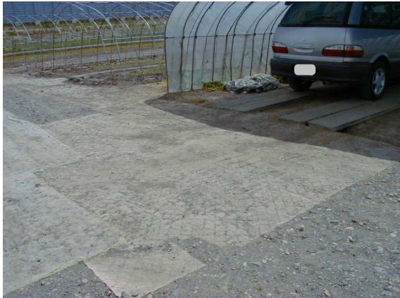
作目：共通 作業：圃場・施設管理 目的：圃場整備 方法：使い古しのカーペットを敷き、ぬかるみ解消。