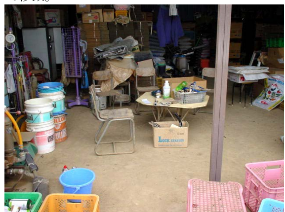
作目: 共通 作業: 共通 目的: 福利厚生 方法: 作業場の一角へ休憩用にイス、テーブルを設置。