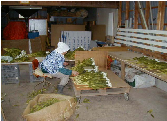
作目：花卉 作業：選別・調製、運搬 目的：作業姿勢改善 方法：選別台を兼ねた運搬台車を製作。