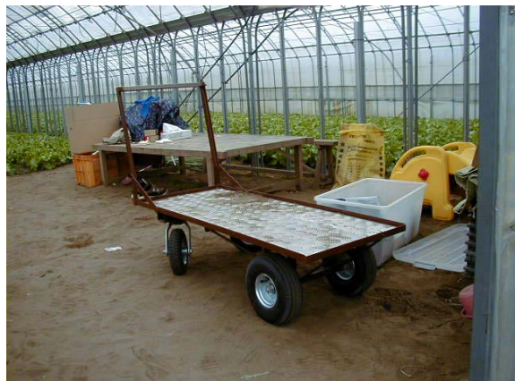
作目：野菜 作業：収穫、運搬 目的：重量物負担軽減 方法：運搬台車を使用。