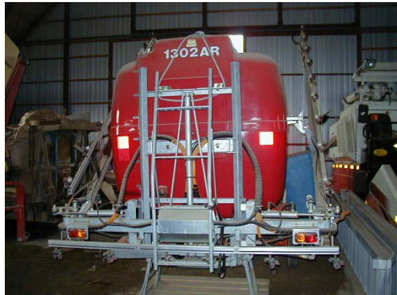
作目：共通 作業：防除、機械使用・管理 目的：作業安全 方法：反射シール付き、ブレーキランプ付き作業機を購入。