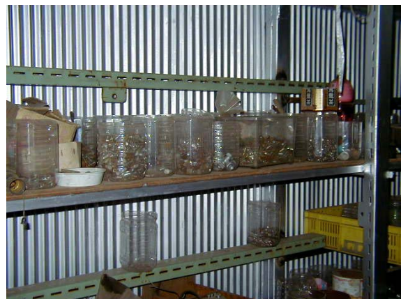
作目：共通 作業：機械使用・管理 目的：施設整備、効率化・省力化 方法：ネジ等部品を種類別、大きき別に収納。見やすいように透明なペットボトルを利用。