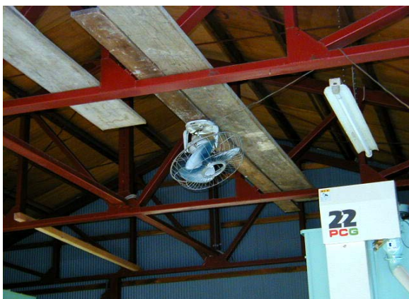
作目：共通 作業：圃場・施設管理 目的：温度調節 方法：扇風機を天井に設置し空気を攪拌。