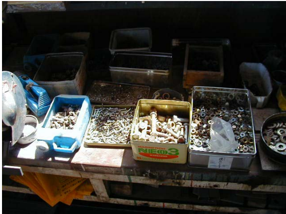
作目: 共通 作業: 機械利用・管理、道具使用・管理 目的: 施設整備 方法: ネジ等部品を種類別、大きさ別に収納。