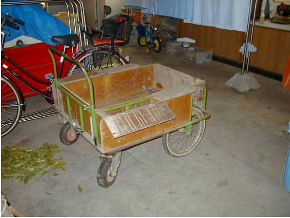
作目：共通 作業：運搬 目的：重量物負担軽減 方法：運搬台車を使用。