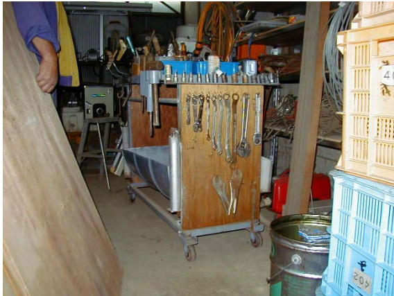
作目：共通 作業：機械使用・管理、道具使用・管理 目的：重量物負担軽減 方法：工具を移動可能な台に収納。大きき順に並べる等の工夫をしている。