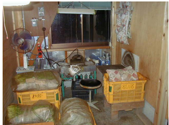
作目：ニラ 作業：選別・調製 目的：騒音低減 方法：ニラのはかま取り機の騒音が大きいので、はかま取り機専用の部屋に移動。共同作業者への影響を解消した。