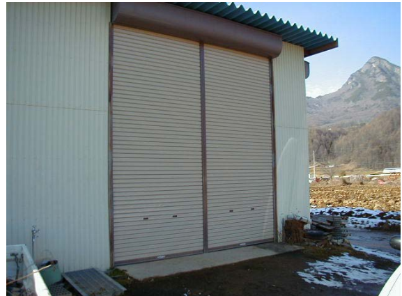
作目：共通 作業：圃場・施設管理 目的：施設整備 方法：作業場の出入口を敷居がなく、広い間口にした。