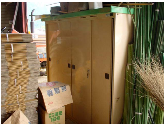
作目: 共通 作業: 農薬取扱・管理 目的: 作業安全、適正使用・管理 方法: カギ付きの専用保管庫へ農薬を保管。