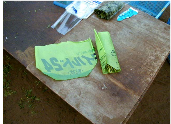
作目：春菊 作業：選別・調製 目的：効率化・省力化 方法：袋詰め時に春菊が袋の入り口に引っかからないようシートへ包んで袋詰め。