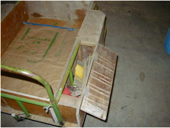
作目：共通 作業：運搬 目的：効率化・省力化 方法：小道具を運搬台車の小物入れへ収納。