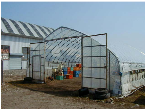
作目：共通 作業：圃場・施設管理 目的：施設整備 方法：機械等が出入しやすいようにハウスの間口を高さ、幅2.5mにし、敷居を除去。