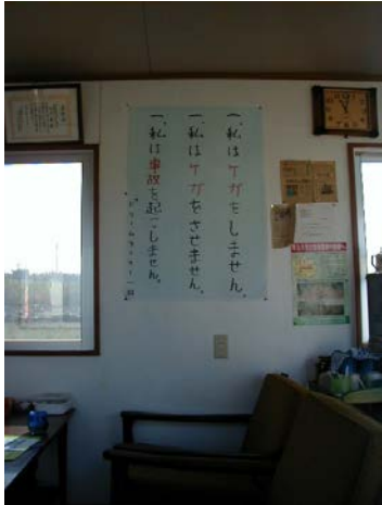
作目：共通 作業：共通 目的：作業安全 方法：作業場内へ安全標語等を掲示。