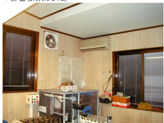
作目：ニラ 作業：選別・調製 目的：温度調節 方法：作業場内にエアコンを設置した。