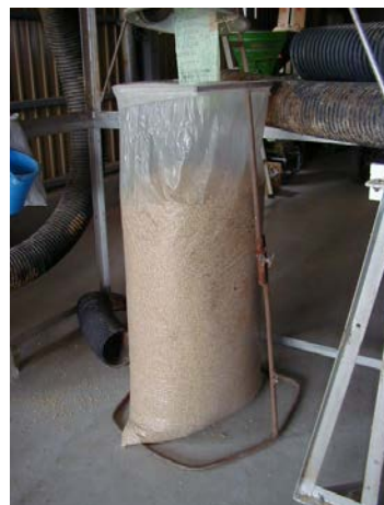
作目：穀類、水稻 作業：選別・調製 目的：効率化・省力化 方法：もみ殻袋を立てる器具を製作。