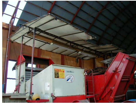
作目：馬鈴薯 作業：収穫 目的：温度調節、明るさ調節 方法：ポテトハーベスタへ日よけ、蛍光灯を装備。