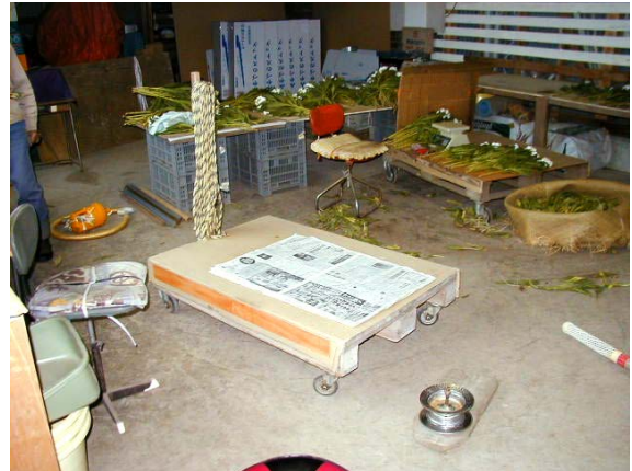
作目：花卉 作業：選別・調製 目的：効率化・省力化 方法：運搬台車に結束ヒモを掛けておくフックを取り付け。