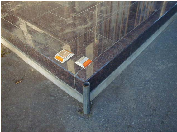
作目：共通 作業：圃場・施設管理、共通 目的：作業安全、施設整備 方法：縁石の角に反射マークを設置。