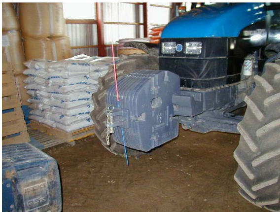
作目：共通 作業：共通 目的：作業安全 方法：トラクタの先端が分るように、目印の棒を取り付けた。