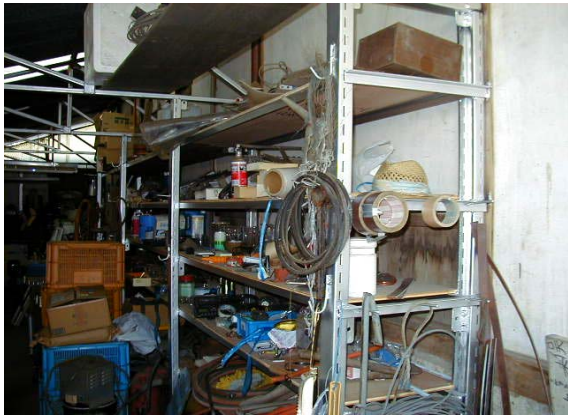
作目：共通 作業：圃場・施設管理 目的：施設整備、効率化・省力化 方法：資材、機械部品等の収納用棚を設置。