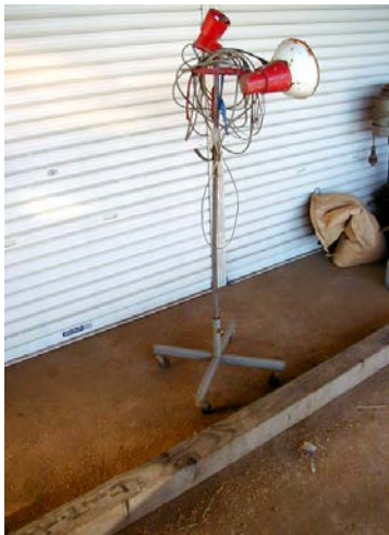
作目：共通 作業：機械使用・管理 目的：重量物負担軽減、効率化・省力化 方法：キャスタ付きライトスタンドを製作。