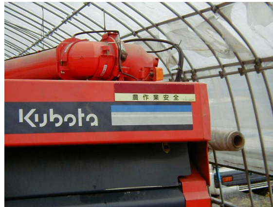
作目：穀類、水稻 作業：収穫、機械使用・管理 目的：作業安全 方法：コンバインへ反射シールを貼り付け。