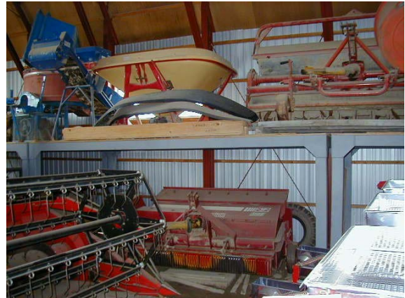
作目：共通 作業：圃場・施設管理 目的：施設整備 方法：資材、機械等の収納用棚を設置。