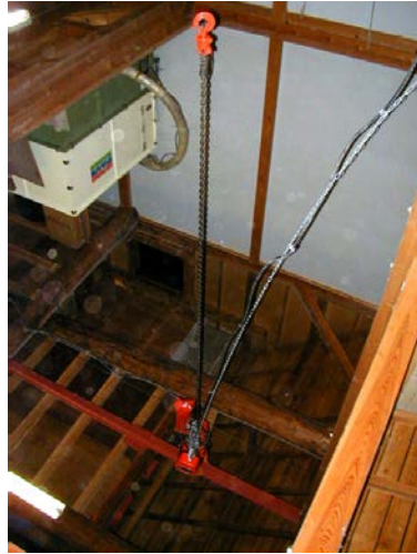
作目：共通 作業：運搬 目的：重量物負担軽減 方法：ホイストで運搬。ただし、釣り上げる質量により、使用には玉掛け技能講習免許が必要。