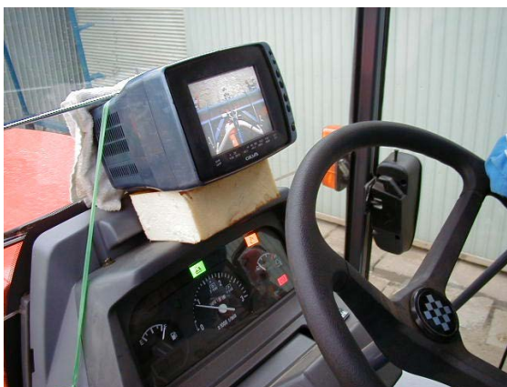
作目：共通 作業：共通 目的：作業姿勢改善 方法：キャビン後部にビデオカメラを、ハンドル付近にモニターテレビを取り付けて後方確認。振り返り動作解消し、首、腰への負担軽減。