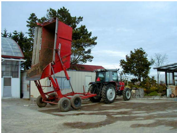
作目：てん菜 作業：収穫、運搬 目的：重量物負担軽減、効率化・省力化 方法：排出しやすいように荷台が大きくダンプするワゴンを製作。但し、転倒に注意。