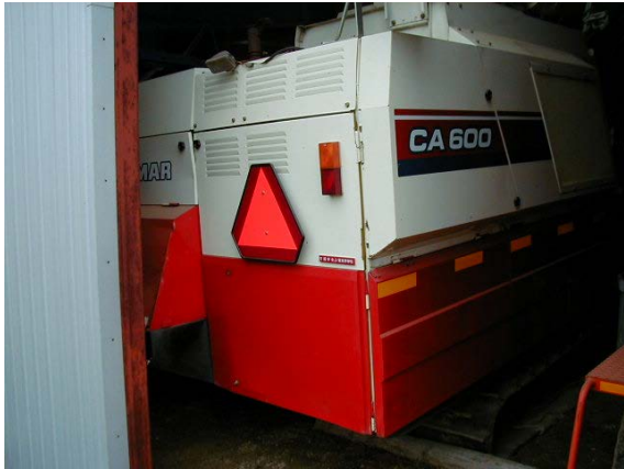
作目：穀類 作業：収穫、機械使用・管理 目的：作業安全 方法：作業機へ反射シール、低速車マークを貼り付け。