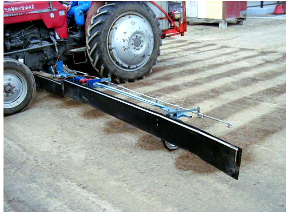
作目：てん菜 作業：防除 目的：環境保全 方法：漂流飛散を少なくするため、ノズルの前へ風除けを設置。作物の上のみに薬液が掛かるようにノズルを配置。