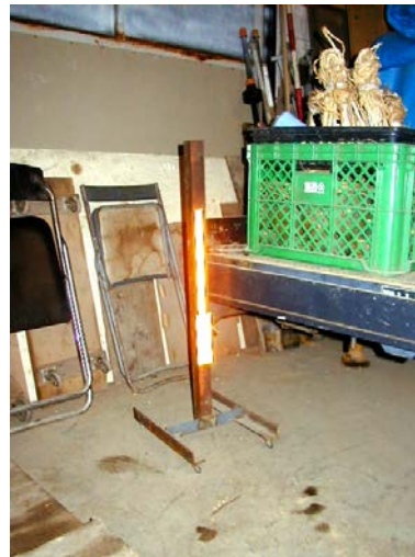
作目：共通 作業：機械使用・管理 目的：作業安全 方法：格納庫へ反射シール付きの棒を立て、機械後退時の印とした。