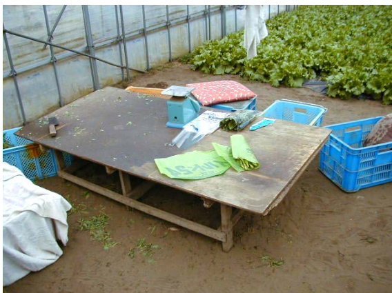
作目：春菊 作業：選別・調製 目的：作業姿勢改善 方法：調製作業用台を使用。