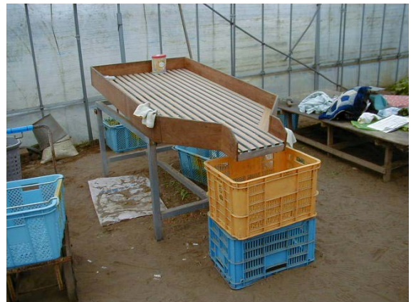
作目：ピーマン 作業：選別・調製 目的：効率化・省力化 方法：選別用台を使用。スノコからゴミが落ちる。コンテナに入れやすいように全体を傾斜させ、出口を狭くしている。