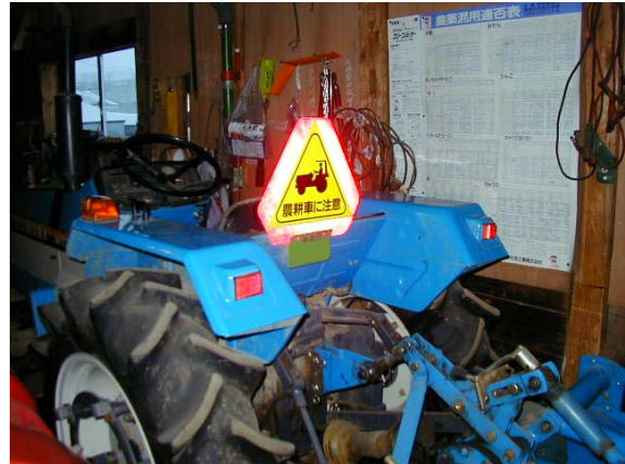
作目：共通 作業：機械使用・管理 目的：作業安全 方法：反射マークをトラクタへ貼り付け。