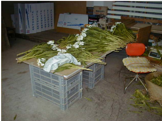
作目：花卉 作業：選別・調製 目的：作業姿勢改善 方法：コンテナを利用し、選別台を設置。