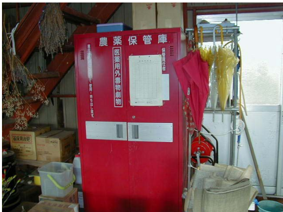
作目: 共通 作業: 農薬取扱・管理 目的: 作業安全、適正使用・管理 方法: カギ付きの専用保管庫へ農薬を保管。