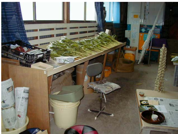
作目：花卉 作業：選別・調製 目的：作業姿勢改善 方法：見やすいように天板を傾けた作業台を設置。