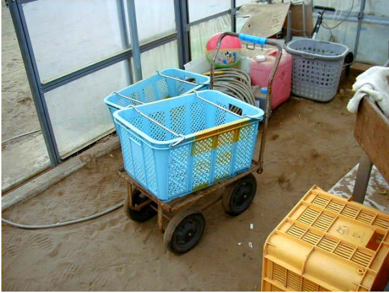
作目：ピーマン、野菜 作業：収穫、運搬 目的：重量物負担軽減 方法：運搬台車を使用。