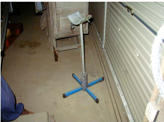
作目：穀類、水稻 作業：収穫、運搬 目的：重量物負担軽減、効率化・省力化 方法：トラックコンテナから乾燥機へ穀物を搬送するバネコンベアのホースを支える器具を製作。