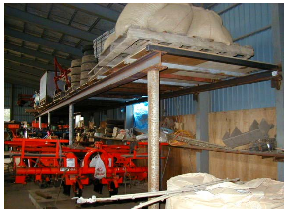
作目：共通 作業：圃場・施設管理 目的：施設整備 方法：資材、機械部品等の収納用棚を設置。