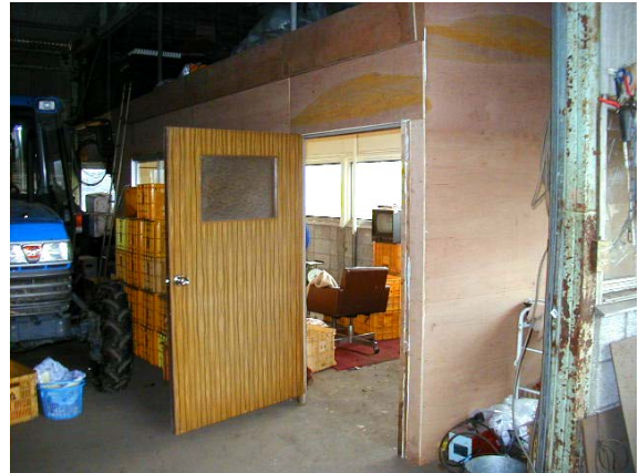
作目：ニラ、野菜 作業：選別・調製 目的：騒音低減、温度調節 方法：小部屋を作り、ニラはかま取り時の騒音の広がりを抑えたり、暖房効率を良くする。