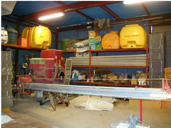
作目：共通 作業：圃場・施設管理 目的：施設整備 方法：資材、機械の収納用棚を設置。