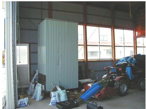
作目: 共通 作業: 共通 目的: 福利厚生 方法: 移動式トイレ（写真中央水色の箱状のもの）を圃場近辺に設置。トラクタ等でけん引して移動。