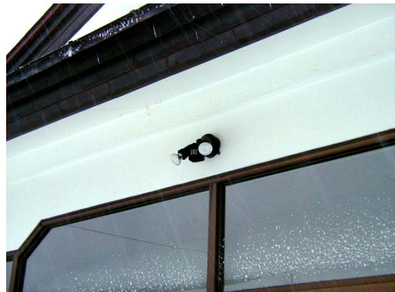
作目：共通 作業：圃場・施設管理 目的：作業安全、施設整備 方法：センサ付きライトを設置。