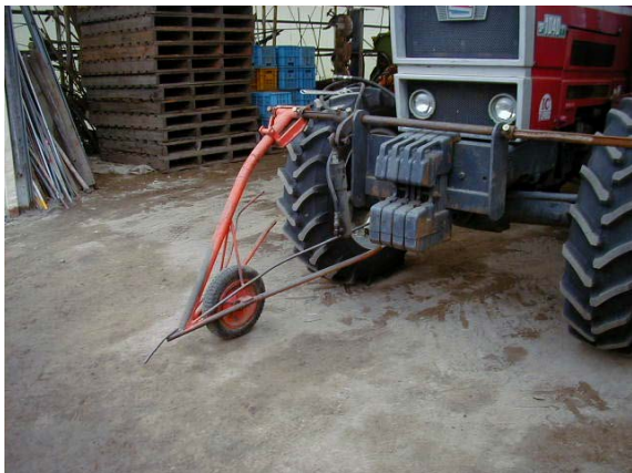
作目：共通 作業：栽培管理 目的：適正使用・管理 方法：走行時に作物を踏まないようにトラクタ前輪へ分草桿（デバイダ）を取り付け。