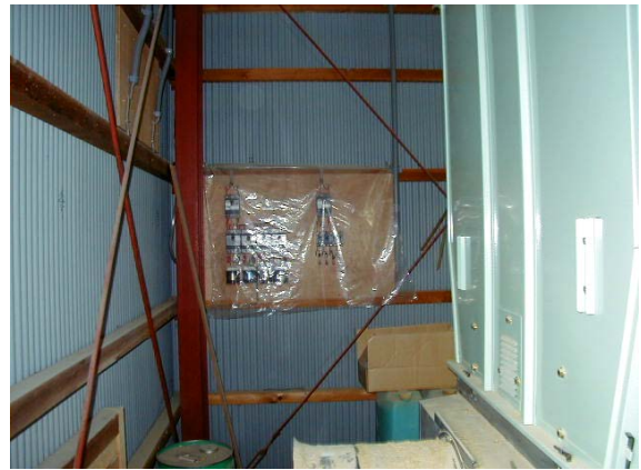
作目：共通 作業：圃場・施設管理 目的：作業安全、施設整備 方法：漏電や火事を防止するため、スイッチ等へカバーを掛けホコリが溜まるのを防止する。