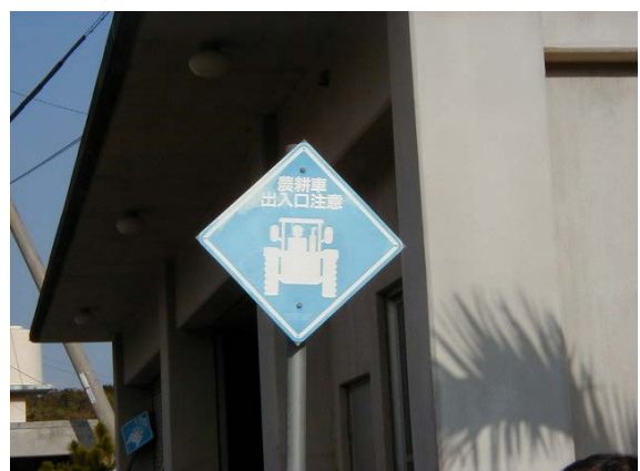
作目：共通 作業：共通 目的：作業安全 方法：交差点等へ危険標示板を設置。