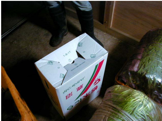
作目：ニラ 作業：選別・調製 目的：手の負担軽減、効率化・省力化 方法：ホチキス止めの不要な箱を開発。