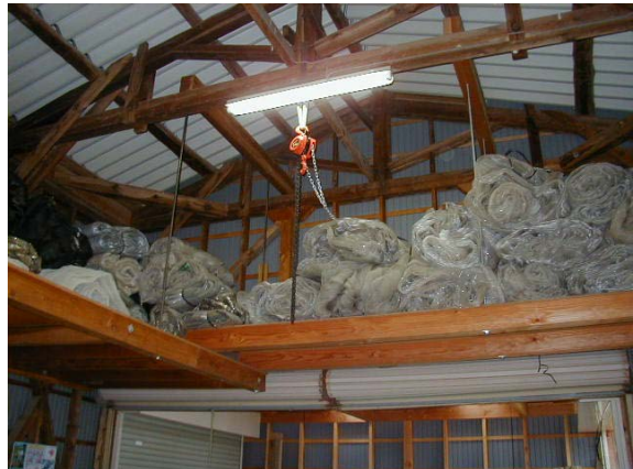
作目：共通 作業：運搬 目的：重量物負担軽減 方法：ホイストで運搬。ただし、釣り上げる質量により、使用には玉掛け技能講習免許が必要。