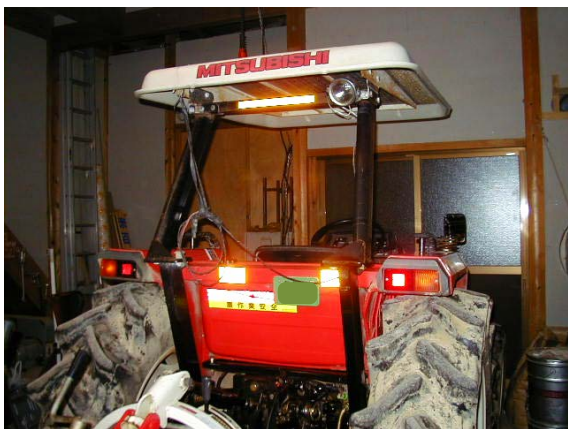
作目：共通 作業：機械使用・管理 目的：作業安全 方法：トラクタ等へ反射シールを貼り付け。