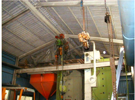
作目：共通 作業：運搬 目的：重量物負担軽減 方法：ホイストで運搬。ただし、釣り上げる質量により、使用には玉掛け技能講習免許が必要。