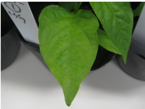
図4 (続き). 接種6日後の接種葉の症状 (PMMoV-J (MAFF104032))

左: 'Tabasco' ( L^2 型品種: 抵抗性反応無し) 右: '台パワー' ( L^3 型品種: 抵抗性反応)