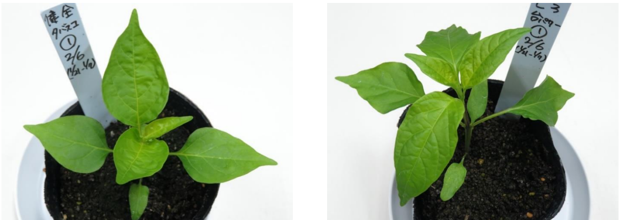
図2. 各供試品種の接種適期の目安