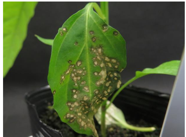
図4. 接種6日後の接種葉の症状 (PMMoV-J (MAFF104032))

左: 'Tabasco' ( L^2 型品種: 抵抗性反応無し) 右: '台パワー' ( L^3 型品種: 抵抗性反応)