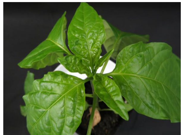
図 5. 接種 15 日後の上位葉 PMMoV-J (MAFF104032) 接種株