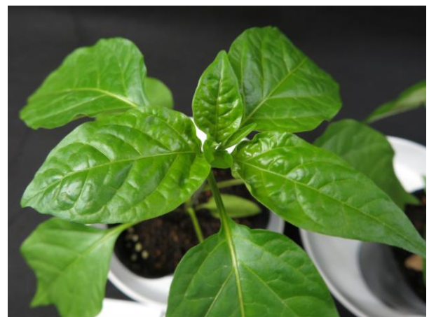
図 6. 接種 15 日後の上位葉 無接種株