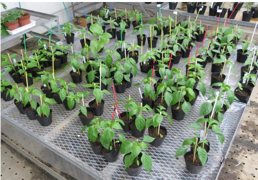
図 7. 試験の実施例 (全景, 2019 年 6 月 27 日撮影)