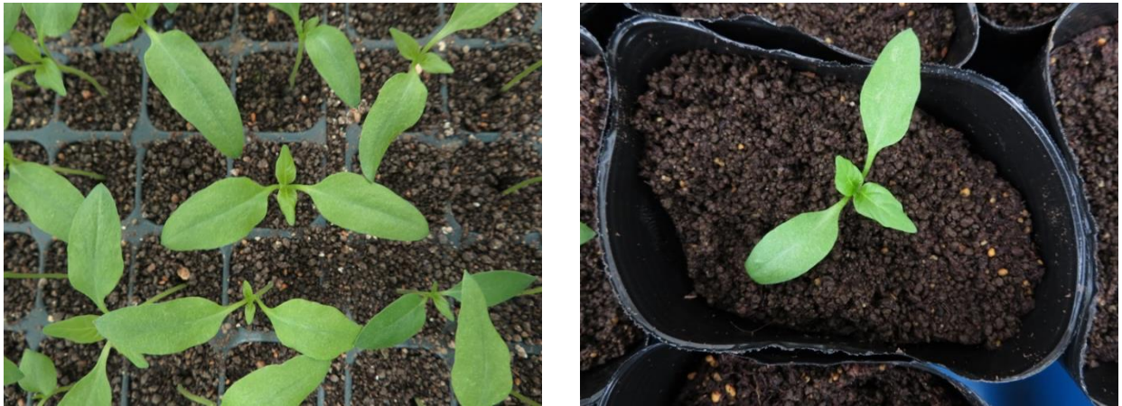
図1. 定植適期の目安(左)及び10.5cmポットに定植した苗

タバコ及びトウガラシのは種から接種及び調査までの目安となる日数及び気温を表2に示した。