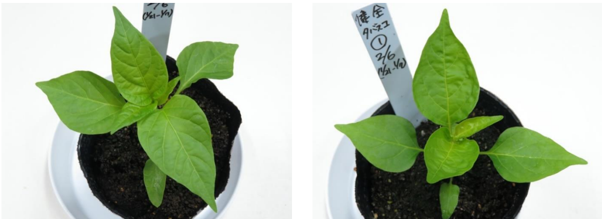
図2. 各供試品種の接種適期の目安

タバコモザイクウイルス(病原型1) 基準品種 (供試ウイルス: PaMMV-J, MAFF260251)