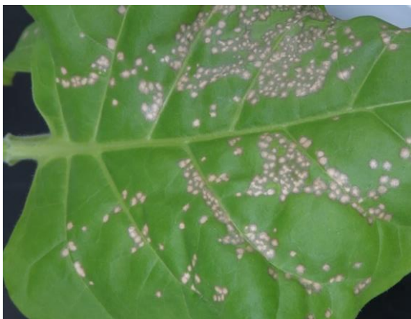
図3. タバコ'Xanthi nc'に生じたトバモウイルスによる局部えそ斑の典型例(接種3日後)

トウガラシへの接種と同時に、接種源の病原性を確認するため、局部病斑宿主であるタバコ'Xanthi nc'にも(3)と同様の方法で接種する。接種から3日後までに、接種葉に数十個以上の局部えそ斑が形成されていれば接種源に病原性があり、接種及び接種後の管理が適切といえる(図3)。