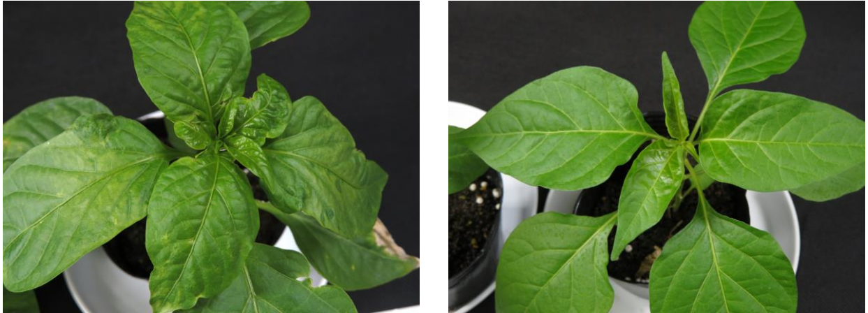
図 5. 接種 15 日後の上位葉 PaMMV-J (MAFF260251) 接種株

接種約 14 日後に接種区の各株の上位葉（主に頂部の新葉から 4 – 5 葉目まで）の症状を、無接種区の上位葉及び基準品種の上位葉と比較し、調査する。感受性品種では、上位葉にモザイク、縮葉又は株のわい化が生じる（図 5 左）。抵抗性品種の場合、上位葉に症状は現れない（図 5 右）。