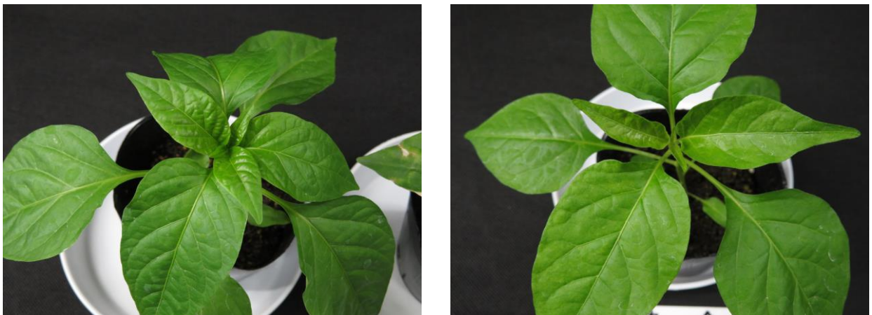
図 6. 接種 15 日後の上位葉 無接種株

左：‘California Wonder’ ( L^1 型品種：感受性反応) 右：‘Tabasco’ ( L^2 型品種：抵抗性反応)