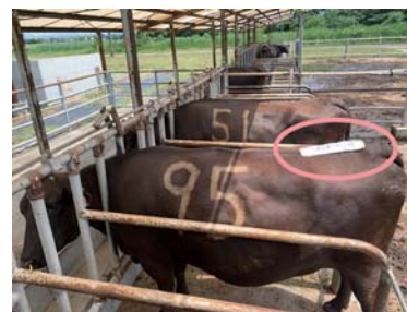
◀ 図3 ツールを台座に固定して雌ウシの尾の付け根に装着した様子