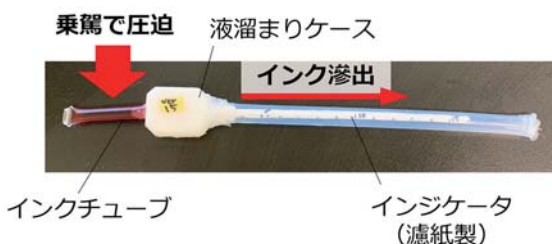
▲図1 人工授精適期判定ツール（試作品）の構造

市販の発情検知補助器具の一部を用いて試作ツールを作製しました（図1）。雌ウシは、発情時に乗駕許容行動という特徴的な行動を示します（図2）。試作ツールを尾の付け根に装着した雌ウシ（図3）が、発情によって乗駕許容行動を示すと、他のウシの乗駕によって、インクチューブが圧迫され、押し出されたインクが液溜まりケースに溜まります。溜まったインクを濾紙製のインジケータがゆっくりと吸い上げることで、インジケータが徐々にインクで染まっていき、そのインク滲出距離によって、最初の乗駕許容行動からの経過時間がわかる仕組みです（図4）。実際にこの試作ツールで推測した授精適期に人工授精を行う試験を実施しており、試行回数を十分に確保して受胎率向上の効果を検証していく予定です。