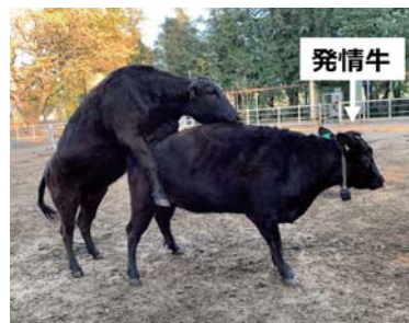
◀ 図2 乗駕許容行動 （乗られて静止している下のウシが発情）