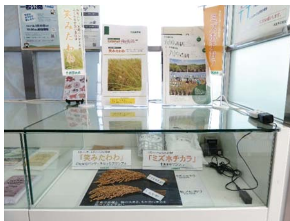
▲ 「笑みたわわ」市販米パンケーキミックスサンプル、「ミズホチカラ」市販米粉サンプル展示の様子

これらの九州沖縄農業研究センターが開発した品種の紹介を通じて、来庁者にお米や米粉の魅力を伝えるとともに、研究成果や取り組みをアピールしました。