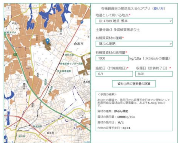
▲図 1 有機物資材の窒素肥効見える化アプリ（熊本県内にある農地での入出力例）

月31日に収穫した場合、この期間中に10a当たりおよそ5.4 kgの無機態窒素が生成され、窒素減肥の可能性を提示しています。