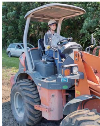
◀ホイールローダに 初乗車した日の写真

その後は少し考えを改め、少しずつ偏見を取り除き、職員として対等であること、素直に教えを乞うことを自分でも意識づけるようになりました。職場内のコミュニケーションは大切と言われますが、私はまだ手探りの状態です。内向的な性格はそうそう変えることができませんが、恐れずに周囲との対話を図りながら、業務に邁進していきたいと思えます。