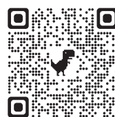
▲簡易動画 （YouTube NARO channel）

本技術の普及拡大は、2021年から成果の現場へのチューニングと実装を担う技術適用研究チームがすすめています。技術説明会等を開催したところ、生産者から「乾田直播に取り組んではみたいが、上手くいくか不安」といった声が多く聞かれ、生産現場で成功事例を示すことが何より重要と考えました。そこで、複数地域での現地実証を通じて本技術に対する理解を深めていただき、面的展開へつなげます。一連の手順は、動画や標準作業手順書など、Web上でもご覧いただけます。