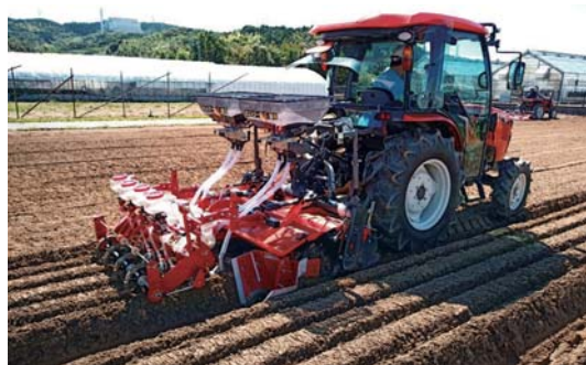
▲写真1 販売されたタマネギ直播機

このタマネギ直播機は、令和3年7月に（株）クボタより市販が開始されました。全農や県とも連携して、いろいろな地域・条件で栽培試験に取り組んで適応条件などが明らかになってきており、現地の状況に応じて使用方法を改善しながら普及活動に取り組んでいます。