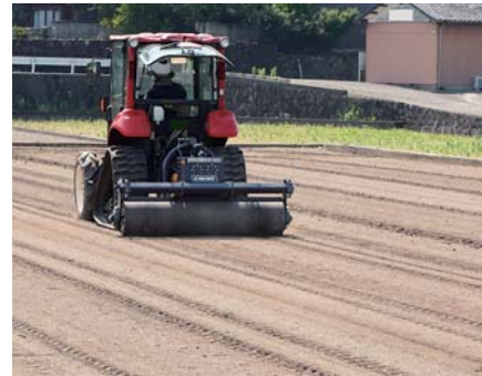
▲写真1 漏水対策の作業風景 （開発した180cm幅振動ローラを使用）

大型トラクタへも装着できる機種開発の要望が出てきました。そこで、従来機よりも作業幅の広い180cm幅のローラを新たに開発し（写真1、表1）、作業時間の短縮（20分以下/10a）と大型トラクタによる作業を実現しました。