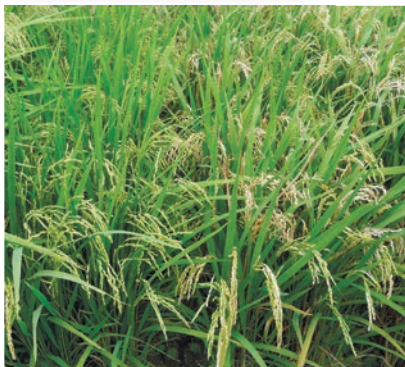
▲えみのあき 萌えみのり 穂いもち検定試験