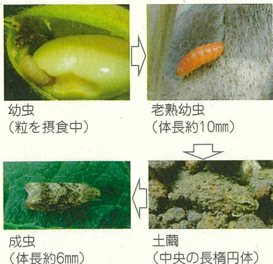
図1 マメシクイガの発育段階

マメシクイガ成虫の発生時期は年次変動が少ないとされていますが、地表への移動消長も同様なのが、移動盛期が生じる要因は何か等の未解明な問題についても、引き続き解明を進めていきます。