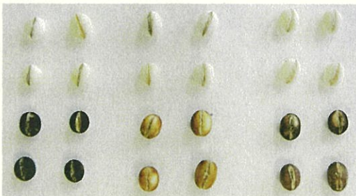
図1 はねうまもちの精麦とヨード=ヨードカリ染色粒 上段：精麦 下段：ヨード=ヨードカリ染色粒 左：ファイバースノウ（うるち） 中：はねうまもち（アミロースフリーもち） 右：在来もち品種（通常もち）

「はねうまもち」の栽培が始まっている北陸地域では、「ファイバースノウ」が作付されています。両者の識別は、種子では図1のようにヨードカリ染色で容易に判定することが可能ですが、立毛段階では草姿がそっくりなため識別することは困難です。「はねうまもち」は突然変異によってWx遺伝子の一部が変化しているので、その変化を検出する品種識別用DNAマーカーも併せて開発しました（図2）。誤植判別だけでなく、「はねうまもち」を交配母本としたときの育種効率化への利用が予定されています。