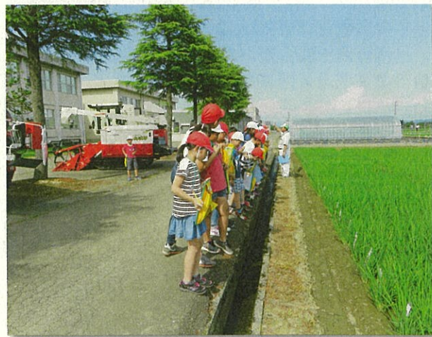
展示圃場でのイネの観察