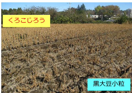
常陸大宮市現地圃場(2013)