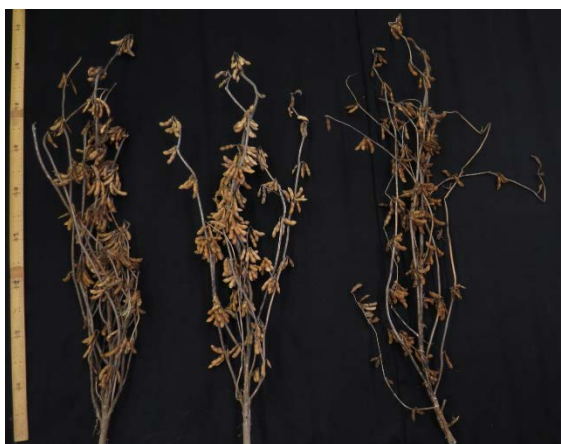
くろこじろう 納豆小粒 黒大豆小粒

「くろこじろう」は「黒大豆小粒」などの古い黒大豆品種に比べて枝が広がりやすく、倒れにくいなど、草姿が優れます。