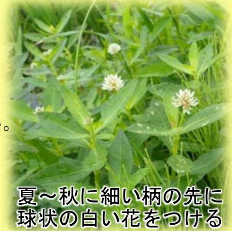
夏～秋に細い柄の先に球状の白い花をつける