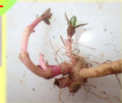
↑ 茎断片から萌芽 根断片から再生→