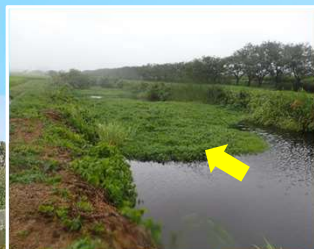
ナガエツルノゲイトウ群落