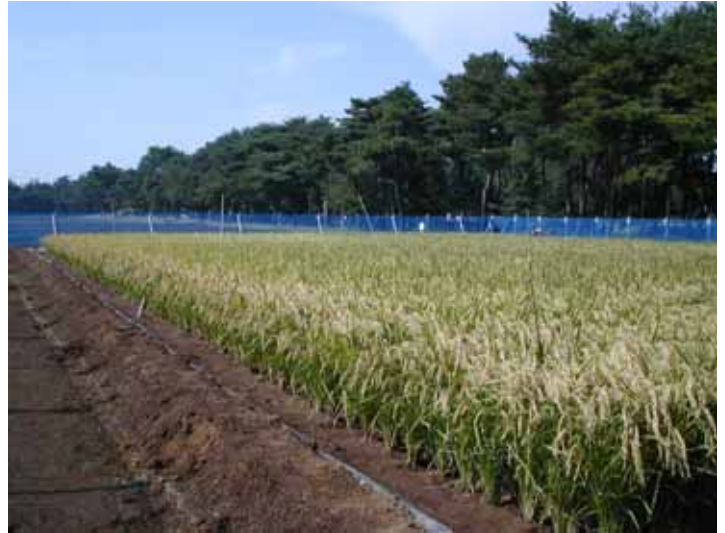
一般試験圃場栽培実験(平成16年)

必須アミノ酸のひとつであるトリプトファンの合成に関与する遺伝子を導入した組換えイネ系統を育成しています。