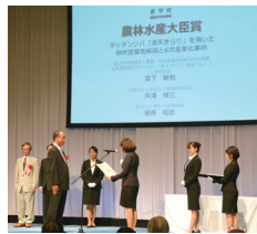
第13回産学官連携功労者表彰農林水産大臣賞の授賞式 (南)小林食品、北農研が連名で受賞

「満天きらり」を用いた製品開発には、隣町の興部町（おこっぺちょう）にある（南）小林食品（株）神門とともに第13回産学官連携功労者表彰農林水産大臣賞を受賞）も加わり、麺、パスタ、お茶などが道の駅「おうむ」や「おこっぺ」で販売されているほか、通販でも販売されています。