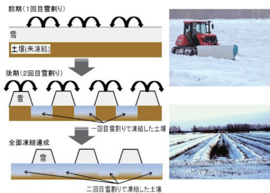
「雪割り」概念図（左）・実施風景と実施後の畑（右）

農業気象、土壌物理、作物生理の知見を結集して、気象予測に基づいた「雪割り」の実施による土壌凍結深制御手法を開発し、生産者自らがWebを利用して「雪割り」作業計画を立案できるシステムとして実用化しました。本技術により、夏の繁忙期の人手による長時間の抜き取り作業から解放され、冬の農閑期の短時間機械除雪による野良イモ防除が可能となり、大幅な省力化と野良イモの無農薬防除を実現しました。本成果は冬の寒さを気象資源として、大規模農地における環境制御技術を実用化した成果であり、公表と共に急速に普及し、現在の実施面積は5,000haに達しています。