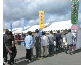
「満天きらり」のソバを求める行列（町内の祭り会場にて）

全国から玄ソバやソバ粉の引き合いがあり、健康食品メーカー、パン・菓子業界などで使われています。