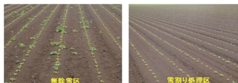
実証試験畑の対照区（未実施）と土壌凍結深制御処理（雪割り）区の野良イモ発生数（上）と野良イモ発生例（下）