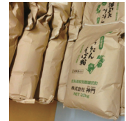
左：（株）神門の製粉貯蔵施設、右：ソバ粉の10kg包装

今、「満天きらり」の加工食品の機能性成分に着目した新たな販売戦略や商品開発の取組が始まっています。道北の冷涼な町、雄武町は、「ますます熱い町になること間違いなし」と感じました。雄武町の地域活性化に思いを馳せ、道半ばで亡くなられた前町長も、きっと喜んでいることでしょう。