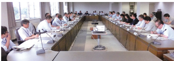
(上) 北農研の総合畜舎（乳牛の飼養試験）の視察 (下) アドバイザリーボード意見交換の様子

委員からは、本年8～9月の台風被害を受けてのリスク管理や危機管理のあり方、農作業の省力化や堆肥の有効活用方法、地域を越えたネットワークの構築、ゲノム情報の活用による健康な乳牛の育種など、生産現場等でご活躍されている立場からの貴重な意見や要望が多く出されました。