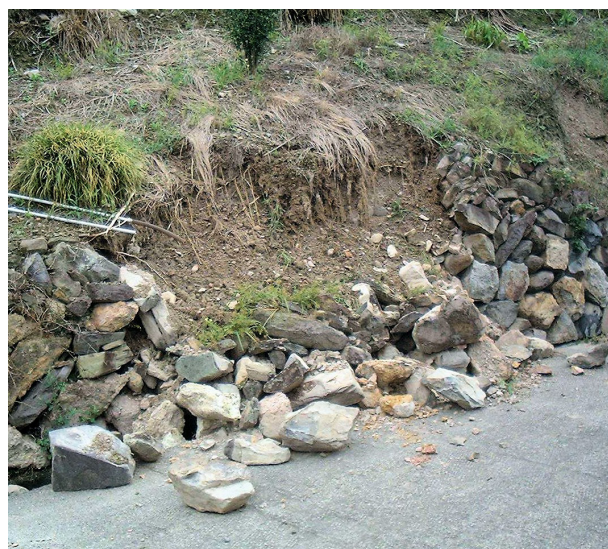
図1 豪雨で崩壊した石垣

急傾斜地のカンキツ園で多く見られる石垣は、豪雨のときに崩壊する場合があります。このような崩壊は、地表水や地下水が集まりやすい場所に石垣がある場合に起こりやすいと考えられます。そのような場所では、一度石垣が崩れたら、ただ積みなおしただけでは再び崩れる可能性が大きいと言えます。ここで紹介する技術は、小規模な崩壊を起こした石垣を、土木工事用の繊維材料を有効に利用することによって、より安全なものに省力的に修復する手法です。なお、このような土木工事の材料として用いられる繊維製品は、「ジオテキスタイル」と呼ばれています。