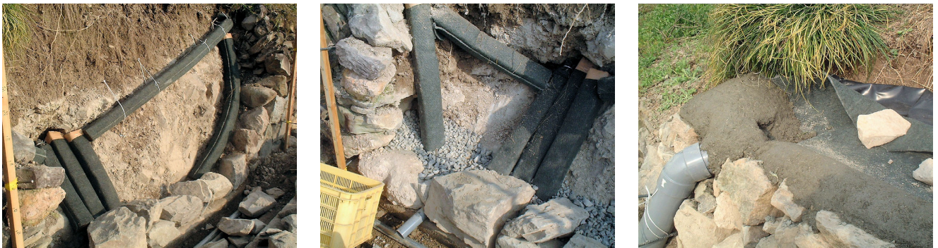
図 4 左：ジオテキスタイルの配置、中央：石垣背面下部の排水、右：地表水の排水

石垣の背後の「裏込め」を行う際に、ジオテキスタイルの周辺と地表近くには硬質な礫や砂利等（一部、園内で採取）を用いて、さらに地表近くには図 4 中央のように塩ビ管を挿入して、排水が迅速に行われるようにしました。