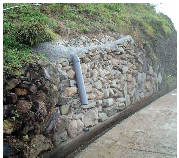
図 5 修復後の石垣

修復後（2004 年 11 月）の石垣の状況は図 5 の通りです。現在も石垣に変状は見られず、正常に機能しています。