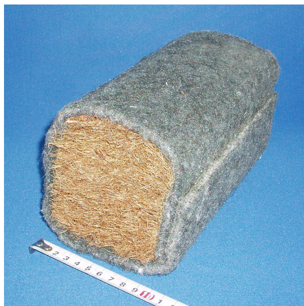
80mm × 80mm の繊維材に厚さ 10mm の不織布を巻いてあるものです。

図1は、2004年10月の台風23号による豪雨で崩壊したミカン園の石垣です。石垣と一緒に崩れた土を取り除いて岩盤の表面を観察したところ、水を多く含んだ破碎部が確認されました。破碎部とは、岩盤がずれて、ずれた面が細かく砕けた状態になっている部分です。このことから、破碎部から浸み出た多量の地下水が石垣の背面の土を緩ませたことによって、崩壊が生じたと推察されました。