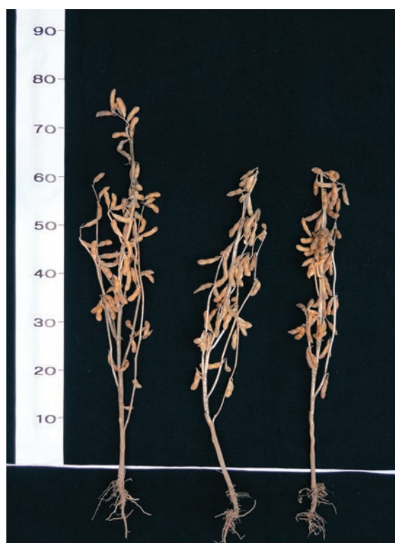
はたむすめ リュウホウ タチユタカ

b) 播種期は2012及び2013年の2ヶ年平均。ただし、普通畑晩播は、ダイズサヤタマバエの大発生による成熟不良となった2013年を除いた。