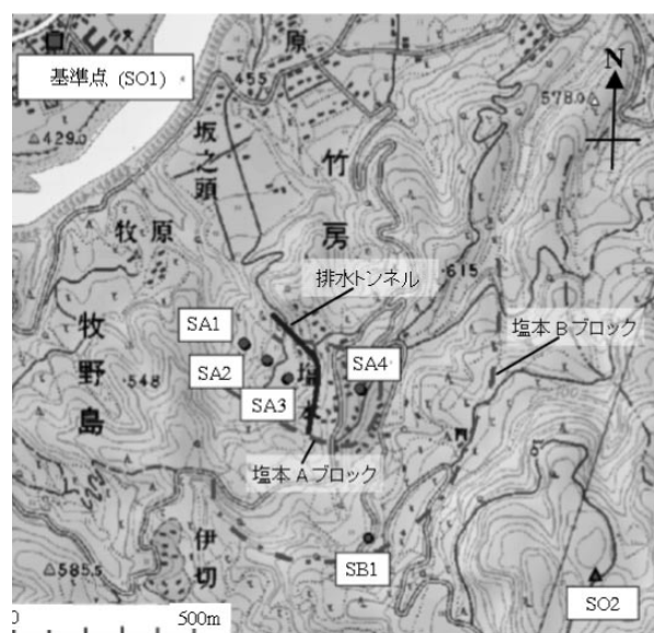
Fig.1 調査地区概要（1/25,000地形図「稲荷山」より） Survey Area

塩本区域には多数の地すべり地形がみられ、近年においても断続的に地すべりが発生している。地質は第三紀