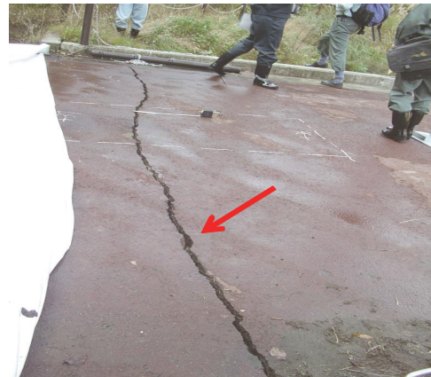
Photo 2 フィルダムの被災事例（天端のクラック） Damage to large fill-dam (Crack at the crest)