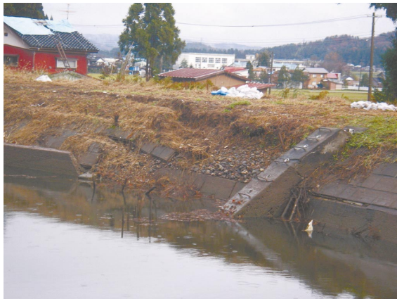
Photo 1 ため池の被災事例（上流斜面の崩壊） Damage to earth dam (Failure of upper slope)