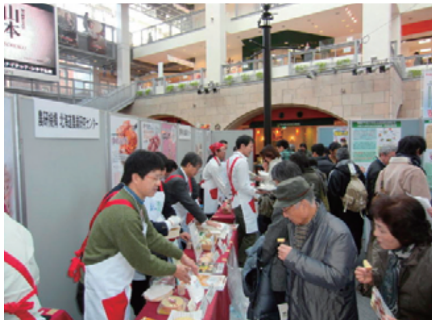
新品種等の紹介、試食

研では、最新の育成品種である超強力小麦「ゆめちから」、ばれいしょの新品種「はるか」、水稻の新品種「ゆきさやか」、「新規米粉」、「じゃが麺」などの展示・紹介を行い、これらを用いた食品もご試食いただきながら、ビジネスにつながる情報交換に努めました。