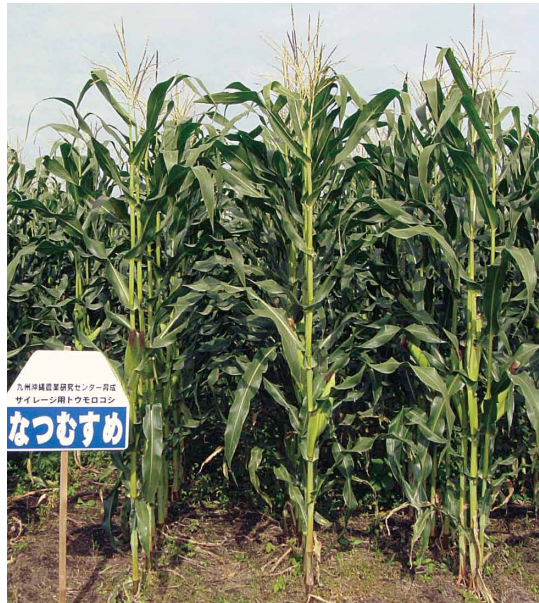
写真 1 「なつむすめ」の草姿