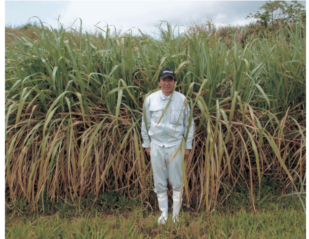
写真3 現地での「しまのうしえ」の草姿（収穫4回目、2年目2番草）

鹿児島県徳之島町において実施した現地試験における耕種概要、収穫調査成績および飼料成分を第10、11および12表に示した。また、徳之島での「しまのうしえ」の草姿を写真3に示した。「しまのうしえ」は「KRF093-1」より株出し栽培での収穫茎数が多かった。「しまのうしえ」の仮茎長は1番草では「KRF093-1」と同程度であったが、冬季を含む期間に生育した2番草では小さかった。茎径は「KRF093-1」と同程度かやや小さかった。蔗汁ブリックスは「KRF093-1」と同程度であった。