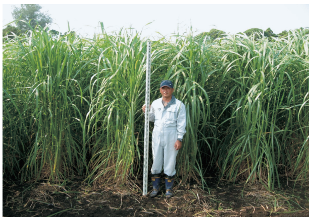
写真1 育成地での「しまのうしえ」の草姿（収穫3回目、2年目1番草）

り短い“中”である。葉幅は「KRf093-1」より広い“やや広”である。葉厚は「KRf093-1」より薄い“やや薄”である。葉身の花青素（アントシアニンにより紫色を帯びる）は“無”であり、「KRf093-1」や「NiF8」と異なる。葉鞘長は「KRf093-1」と同じ“中”である。葉鞘の毛群は“無”で「KRf093-1」より少ない。葉鞘の蠟質物は「KRf093-1」と同じ“少”であり「NiF8」よりも少ない。蔗茎の形態は「KRf093-1」と同じ“円筒型”である。蔗茎の基本色は「KRf093-1」と同じ“黄緑”である。茎長は「KRf093-1」と同じ“長”であり、「NiF8」よりも長い。茎径は「NiF8」の“中”より細く、また「KRf093-1」の“細”より細い“かなり細”である。節間数は「KRf093-1」よりやや少ない“や