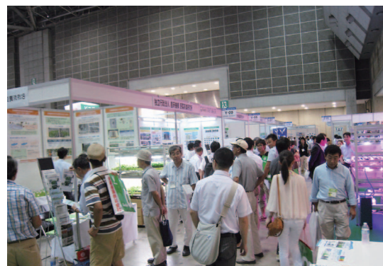
九州実証拠点とつくば実証拠点（野菜茶業研究所）の植物工場展示ブース