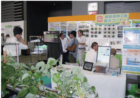
植物工場九州実証拠点の展示コーナー

スプラウトの新しいメニューや根を観察できるレタスの栽培セット、イチゴの高設栽培セットなどを展示紹介したところ、見学者から多くの質問が寄せられました。