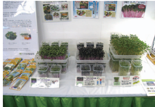
着色系のかいわれ大根とダッタンそばスプラウトの展示