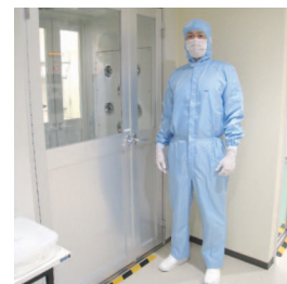
専用の作業着を着用した後エアシャワーを通過し、完全人工光型植物工場エリアに入室