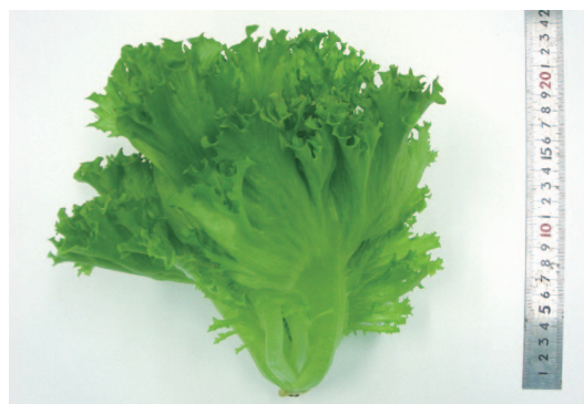
図3 HEFL光源で栽培したリーフレタス (品種「フリルアイス」)