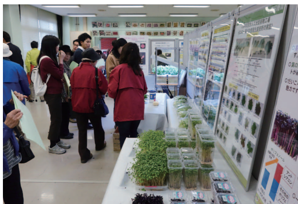
室内展示会場の様子とスプラウトの展示