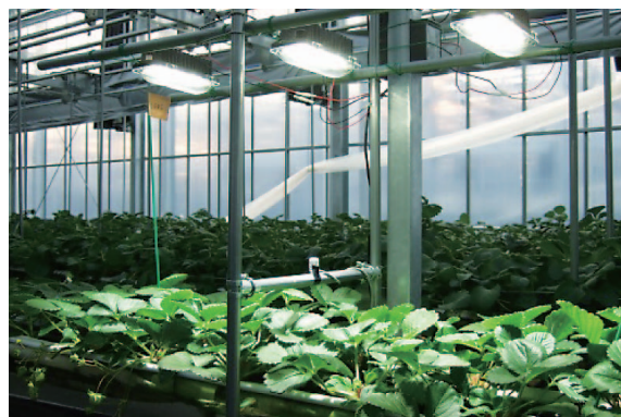
図3 高輝度LEDによる補光