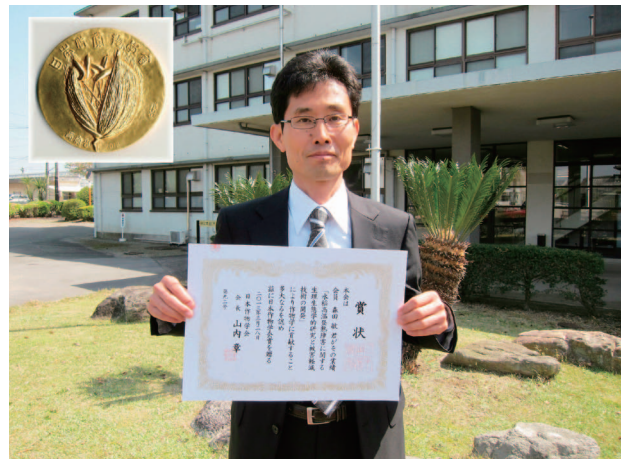
森田上席研究員(左上は受賞メダル)

施肥法「気象対応型栽培法」を提唱するとともに乳心白粒の発生程度を収穫前に判定する玄米断面の測定技術も開発しました。この技術は、共済制度の被害補償にも活用できる装置として実用化されています。