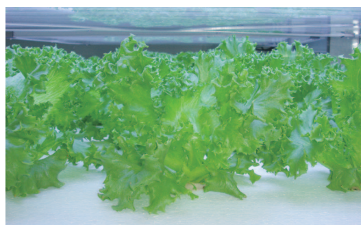
図2 HEFL光源でのリーフレタスの栽培 (品種「フリルアイス」)