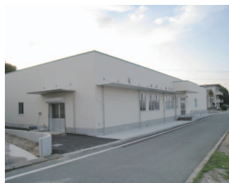
完全人工光型植物工場が設置されている研修施設棟