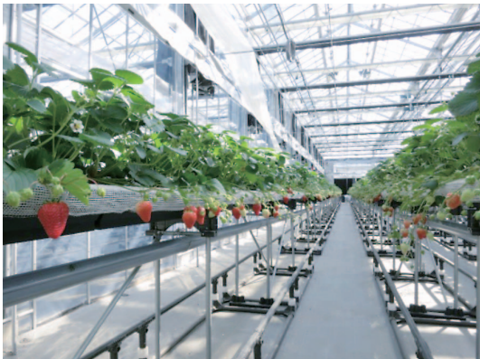
イチゴの促成（冬春どり）栽培