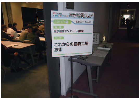
産学連携フェアのセミナー会場

北九州学術研究都市で開催された産学連携フェア（主催：北九州学術研究都市産学連携フェア実行委員会、公益財団法人北九州産業学術推進機構、2012年10月17～19日）で植物工場九州実証拠点の取り組みを紹介しました。