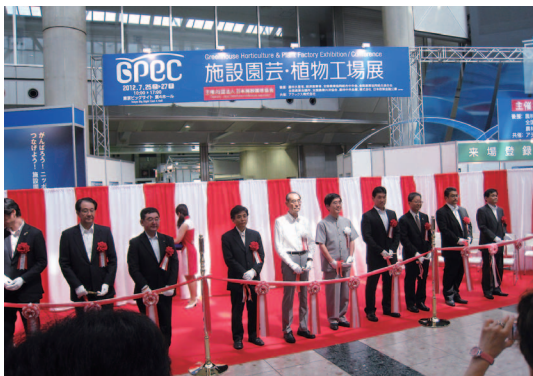
開会式（テープカット）

GPEC（主催：日本施設園芸協会、会場：東京ビッグサイト、2012年7月25～27日）に出展しました。太陽光利用型植物工場のイチゴ、完全人工光型植物工場のレタスおよびスプラウト類に関するポスターや実物を展示したところ、多くの見学者が訪れました。