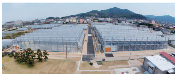
太陽光利用型植物工場施設

それぞれの栽培室では2つのコンソーシアムがレタスとスプラウト類の高付加価値生産技術の実証試験を行っています。作業員による病害虫、異物などの持ち込みを防ぐため、完全人工光型植物工場エリアの入り口にはエアシャワーが設置されています。