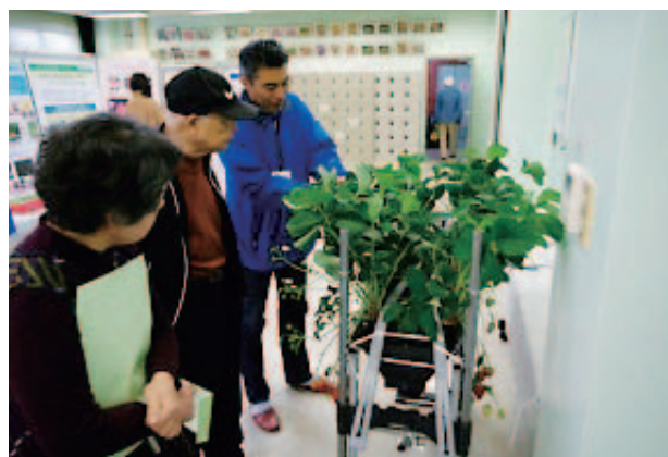
栽培セットを使ったイチゴ多収技術の説明