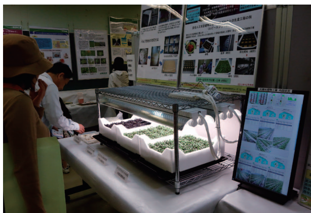
新しい種類のスプラウトの展示