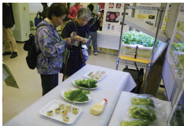
植物工場産レタスを使ったサラダの試食