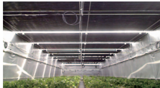
定植後の短日処理