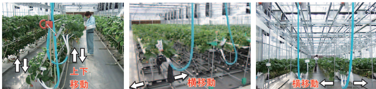
図1 イチゴの可動式高設栽培装置 (左: シーソー式、真中: スライド式、右: 吊り下げ式)