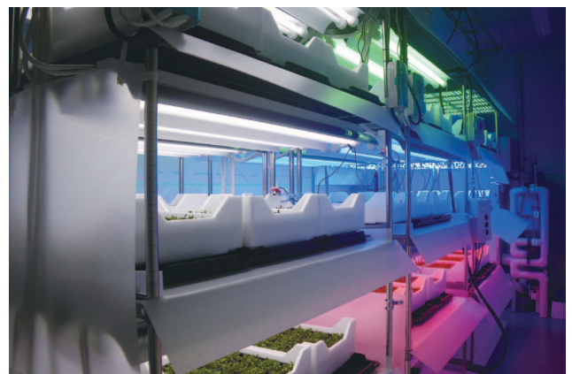
太陽光利用型植物工場でのイチゴ栽培と完全人工光型植物工場でのレタス、スプラウト栽培