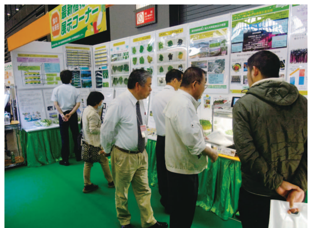
西日本食品産業創造展 '13 への出展