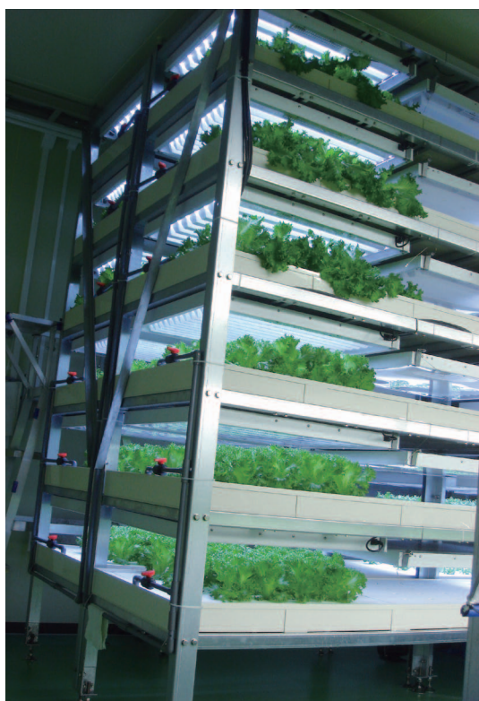
図1 ハイブリッド電極蛍光管(HEFL)光源を用いた栽培システム