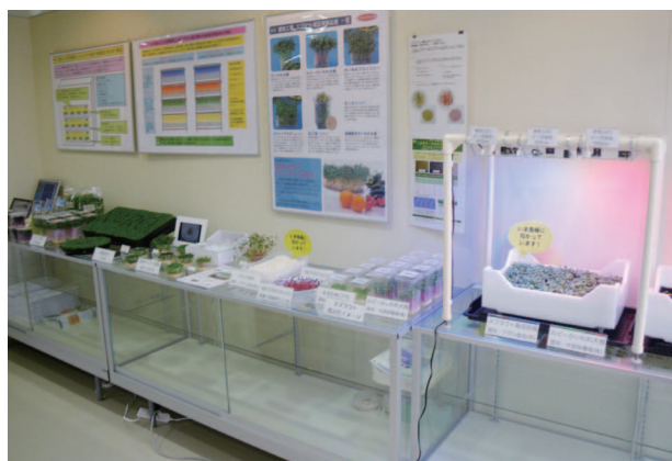
パネル、栽培セットの展示

〒839-8503 福岡県久留米市御井町1823-1 農研機構 九州沖縄農業研究センター 筑後・久留米研究拠点野菜花き研究施設 TEL:0942-43-8271 FAX:0942-43-7014