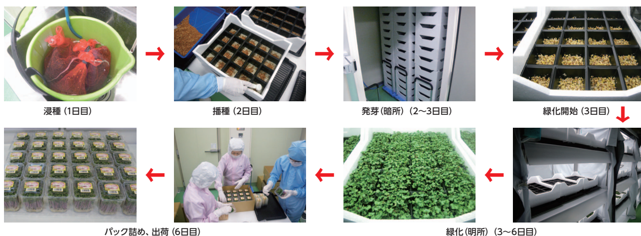
図2 作成した栽培工程