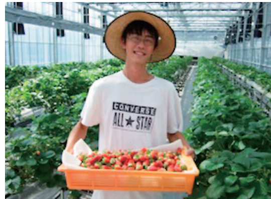
夏秋どりイチゴの収穫