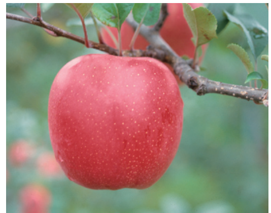
Fig. 3 Fruit of ‘Kotaro’