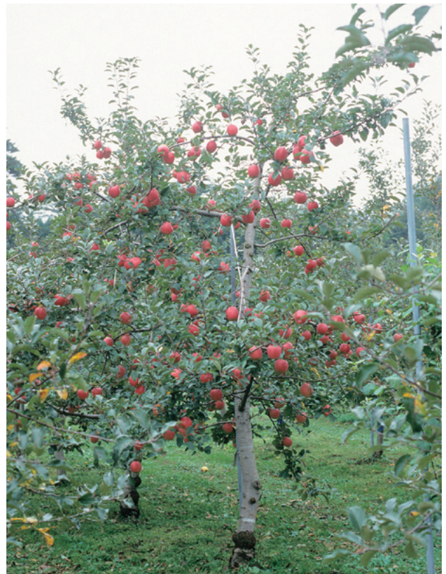
Fig. 2 Bearing tree of ‘Kotaro’ on M.26 (10-years-old).