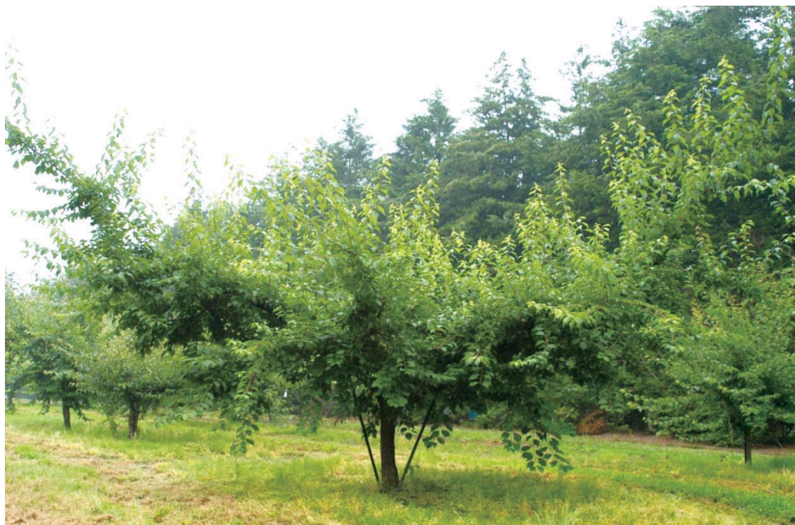
Fig.2 Tree shape of 'Suiko' .