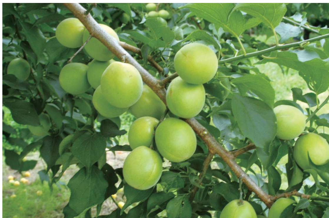
Fig.3 Fruit of 'Suiko' .