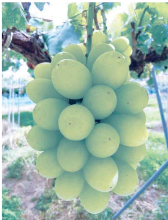
Fig.3 A seedless cluster of 'Sun Verde' .