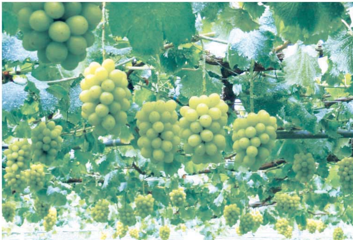
Fig.2 Seedless clusters of 'Sun Verde' on the vine. .