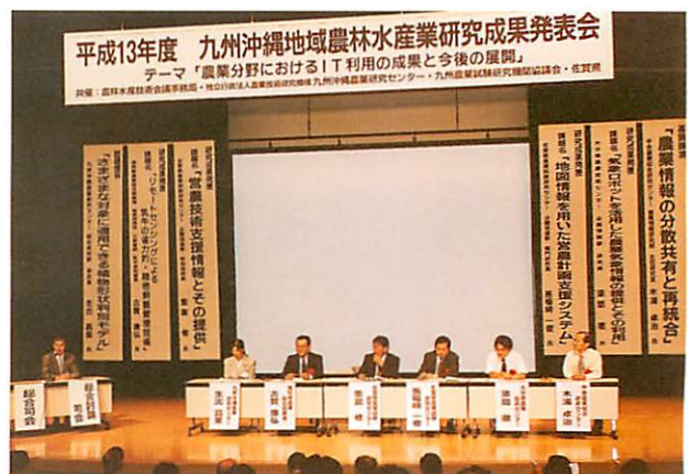
発表者を中心にした総合討論