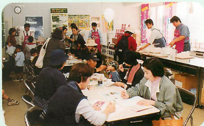
好評な試食コーナー