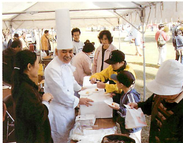
好評なニシノカオリ食パンの試食と即売コーナー