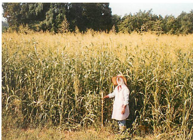
写真2. 作溝型播種法でのスーダングラスの草勢 供試品種ヒロワンを7月31日に播種。収穫時（10月3日）草丈は約2.5mに達している。

作溝型播種法で酪農家のイタリアンライグラス跡にスーダングラスを栽培した例である。我が国で育成された「ヒロワン」の7月末播種の試験で、写真2のように定着は安定し、乾物重で500~1000kg/10aを収穫できる。