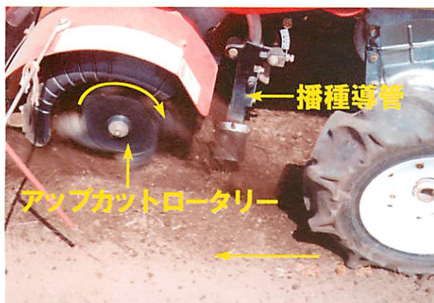
写真1. 改良播種ロールを用いた作溝型播種機 種子ホッパー直下の改良播種ロールの溝穴に入った種子は、播種導管からアップカットロータリーで削られた土中の作溝部に落下し、ロータリーで掻き上げられた土で覆土される。その直後に、施肥と鎮圧が行われる。

この播種法は、市販の稲・麦の不耕起播種機（M社）を飼料作物の播種に応用するものである（写真1）。播種ロール方式のロールを改良し、ギニアグ