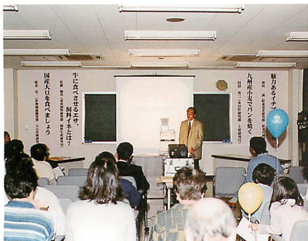
生産者の参加が多かった講演会場