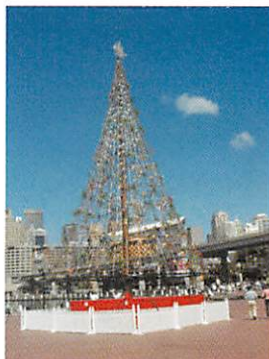
夏のクリスマスツリー