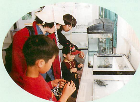
人気を集めた動物たち