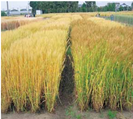
写真1 「ちくごまる(左)」と「農林61号(右)」

ノーマルアミロースタイプコムギの特徴であるその高い汎用性から、九州各地で70年近く栽培されてきた「農林61号」も土壤伝染性ウイルス病であるコムギ縞萎縮病の拡大で、栽培できる地域が減っていました。後継品種としてさまざまな系統が検討されましたが、日本めん用の品質基準値であるたんぱく質含有率10.5%を達成することが容易なこと、原粒の灰分値が低く、同じく品質基準値の灰分1.60%以下を超える心配がほとんどないこと、さらに、グルテンの性質が「農林61号」と似通っていたことなどが評価されて、「西海191号」は、「農林61号」代替品種候補「ちくごまる」となりました(写真2、表1)。