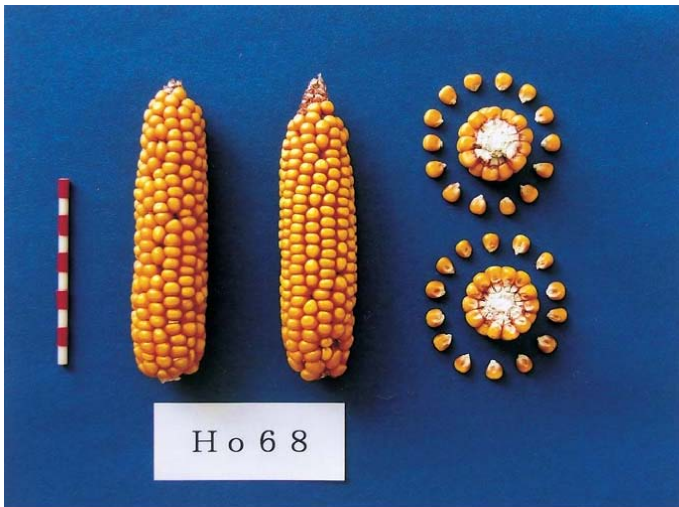
写真2 「Ho68」の雌穂および粒 (2004年12月24日撮影)