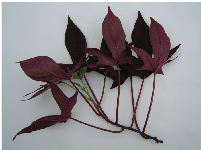
写真4 「九育観2」の地上部