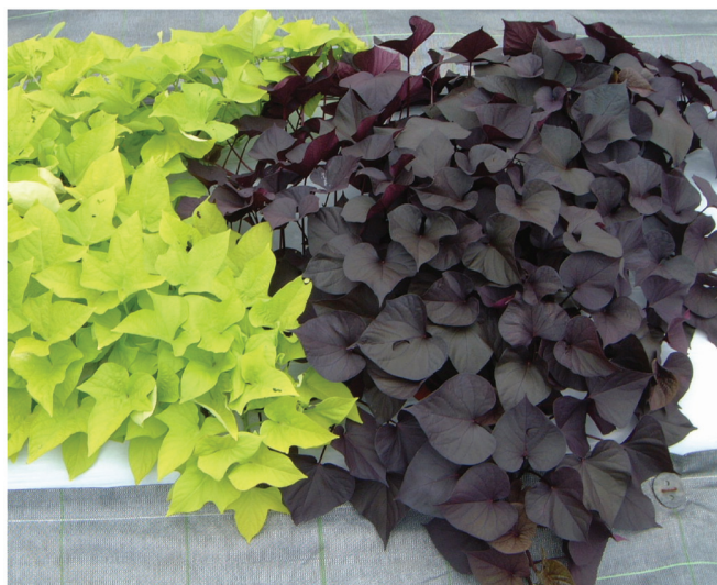
写真3 「九育観1号」と黄葉品種との寄せ植え