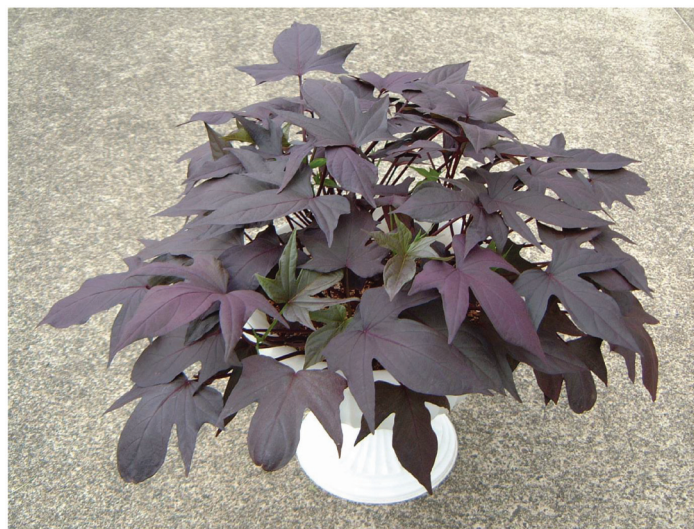
写真5 「九育観2」のポット栽培

塊根におけるアントシアニン色素の組成については、栽培条件により若干変動することが報告されている 6) ものの、その品種間差異は明確であり安定した遺伝的形質であることが多くの報告 7-9, 12, 15, 16) の結果により支持されている。一方、カンショ茎葉部に含まれるアントシアニンの含量・組成については、Yoshinagaら 18) が頂葉部および茎部のアントシアニン組成を13品種・系統について調査した例およびIslamら 4) が3品種・系統の葉身について調査した例があるが、年次間や栽培条件による変動などについての検討はなされていない。本試験においては、「九育観1号」では年次間および異なる栽培条件(圃場-温室)間において色素組成比の有意差は認められ