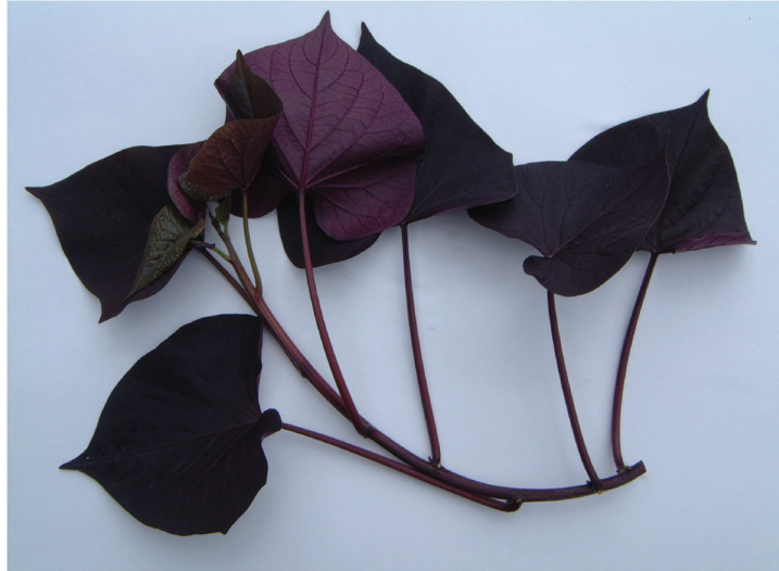
写真1 「九育観1号」の地上部