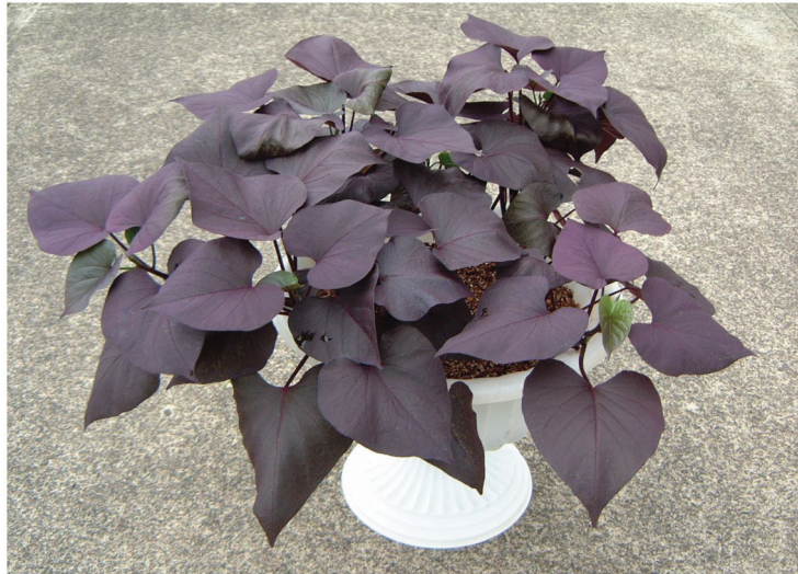
写真2 「九育観1号」のポット栽培