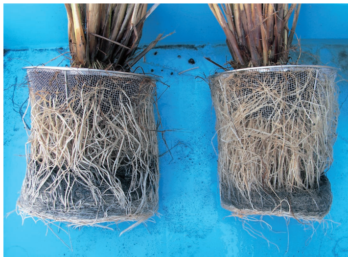
写真3 タチアオバ（左）ミナミヒカリ（右） 株基部と根