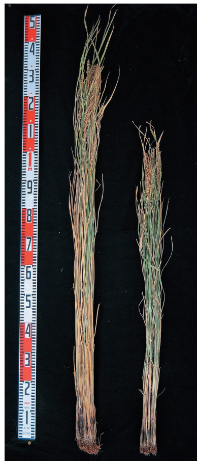
写真2 タチアオバ (左) ユメヒカリ (右) の個体