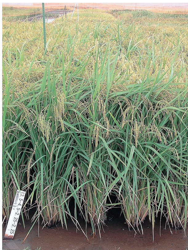
写真1 タチアオバの立毛草姿