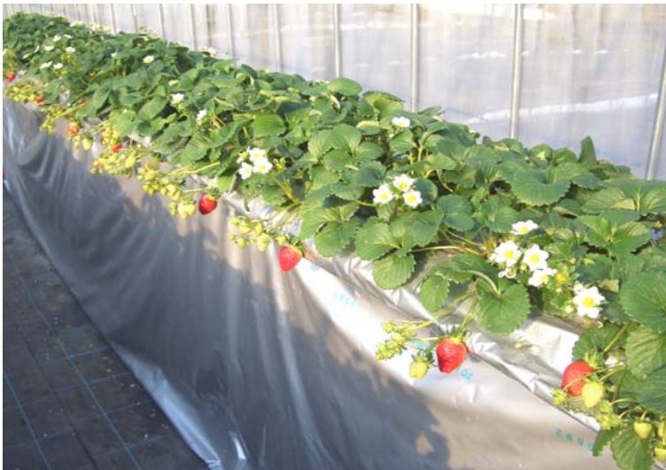
高設栽培イチゴ 作業のしやすい高さにあるのでシニア世代でも楽々

ふつうのイチゴ作りは、しゃがんでの作業なので体がきつく、手間もかかりますが、最近ハウスで作業台感覚で仕事のできる高設の促成栽培が増えてきました。ただ、このやり方では、イチゴの株全体が宙に浮いているので、残暑がまだまだ厳しい秋口に植え付けると、日差しによって株の温度が上がってしまいます。すると、12月から5月まで続く収穫期のうち、果実が主枝の先につく12月の収穫(第1果房の収穫)はいいのですが、第2果房になるはずの側枝部分の花つきが遅れて、1月頃に収穫の中休みができてしまいます。そこで、夏の暑い日の打ち水と同じしくみを利用して、水やりで余った水が株下にしみ出てくるところに風をあてて、イチゴを根の部分から冷まして花が遅れないようにします。こうして、12月から途切れなく収穫できるよう装置を改良中です。