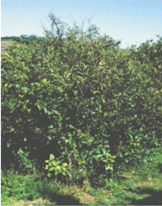
第1図 ハッサク萎縮病