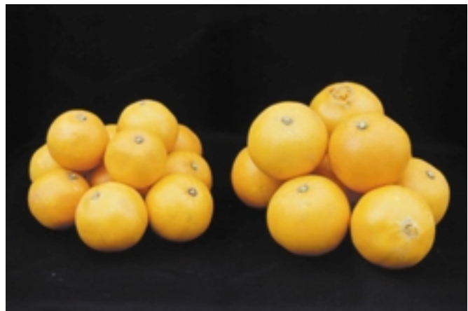
第6図 森田ネーブルへCTV弱毒系統接種による果実の大玉化 左：強毒，右：弱毒