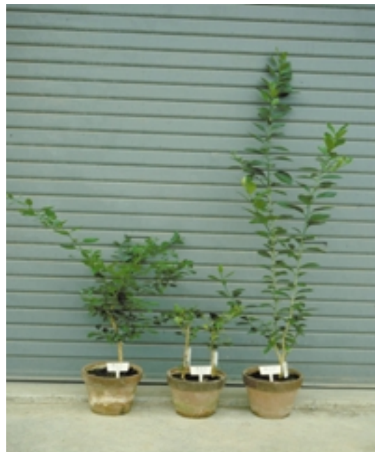
第3図 メキシカンライムによるCTV弱毒系統の選抜 左：弱毒，中：強毒，右：健全