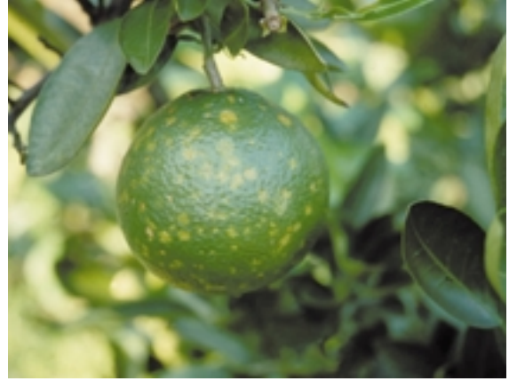
第2図 イヨカンのCTV-SY強毒系統によるかいはう虎斑病