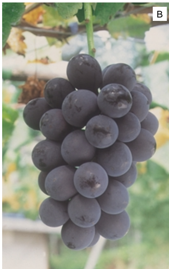
Fig. 2. Fruiting shoots (A) and fruit cluster (B) of 'Dark Ridge' grape.