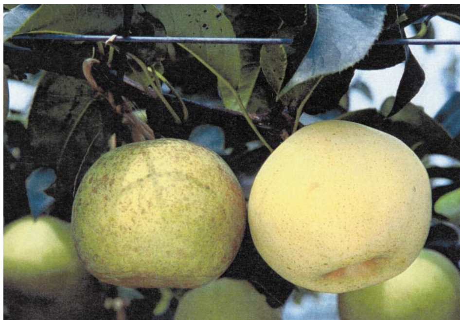
Fig. 3. Fruits of 'Shuurei'. Grown with (right) and without paper bag (left).