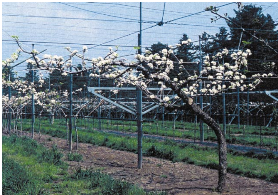
Fig. 2. Tree form of 'Shuurei'.