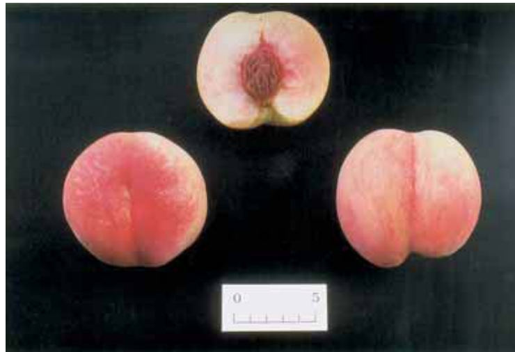
Fig. 4. Fruit of ‘Natsuotome’.