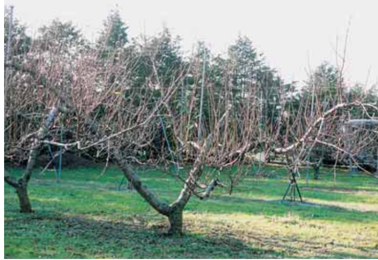
Fig. 3. Tree form of ‘Natsuotome’.