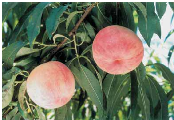
Fig. 5. Bearing shoot of ‘Natsuotome’.