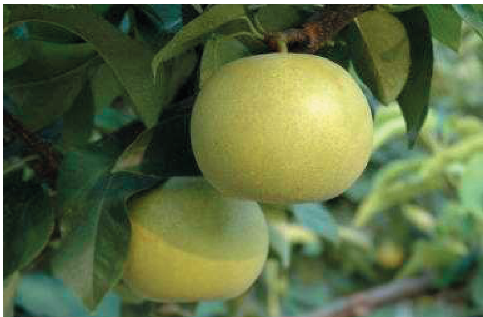
Fig. 3. Fruits of 'Natsushizuku'.