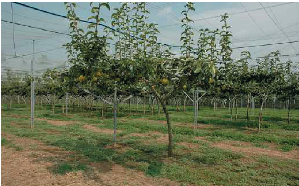
Fig. 2. Tree form of 'Natsushizuku'.