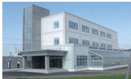
寒地農業生物機能開発センター

北海道の気候環境や生物機能を活用したクリーンな寒地農業の実現に向けて、作物・土壌微生物間相互利用の研究や作物の低温耐性・機能性強化研究等を加速するための設備が整っており、これまでに、「複合環境ストレス耐性イネの作出」「ダイズの遺伝子組換え技術の開発と種子成分改良への利用」等の研究成果を挙げました。