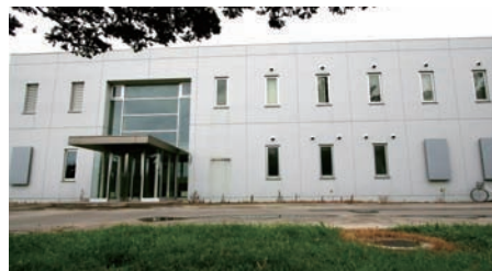
流通利用共同実験棟

園芸作物の品質・成分や組織培養に関する研究開発のための設備が整っており、これまでに機能性成分を多く含むタマネギ、短節間性かぼちゃ、切り花用アリウムなどの品種が本施設を利用して育成されました。この他、スイカなどの高品質種なし化のための軟X線照射花粉の長期保存法が開発されました。なお、倍数性育種に関する共同研究を強化するために、新たにフローサイトメーター（異数性・倍数性測定装置）および正立型蛍光位相差顕微鏡システム（染色体等の植物微細構造調査用）を整備しました。