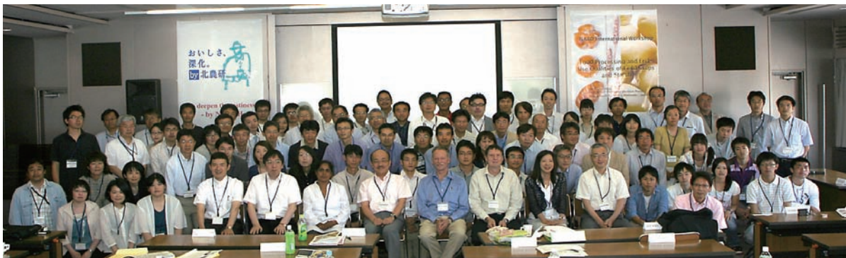
講演会参加者が一同に会して（北海道新聞帯広支社 大会議室）

総合討論では、招聘研究者から「欧米諸国に比べて日本は健康機能性穀物の市場の拡大が見込めるので、今後の穀物研究が重要である」、「北海道で育成された小麦品種『ゆめちから』、『きたほなみ』が期待できる」等の意見を頂きました。参加者からは、「今後の機関連携が可能となる、充実したワークショップ」と評価されました。