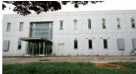
流通利用共同実験棟

園芸作物の品質・成分や組織培養に関する研究開発のための設備が整っており、これまでに機能性成分を多く含むタマネギ、短節間性がぼちゃ、切り花用アリウムなどの品種が本施設を利用して育成されました。この他、スイカなどの高品質種なし化のための軟X線照射花粉の長期保存法が開発されました。なお、倍数性育種に関する共同研究を強化するために、新たにフローサイトメーター（異数性・倍数性測定装置）および正立型蛍光位相差顕微鏡システム（染色体等の植物微細構造調査用）を整備しました。