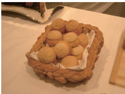
「ゆめちから」を使ったパン

されたものでした。来場者の皆様はアルコール片手に、おいしい料理をご堪能され、研究者とのディスカッションも盛況でした。北海道農研のブースでは折登所長が研究成果PRの広告塔として対応しました。今後も、このような機会を利用し、北海道農研の成果の普及に努めて参ります。