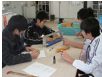
トウモロコシ選抜体験