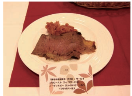
サーロインのロースト「ノーザンルビー」のベイクドポテト添え