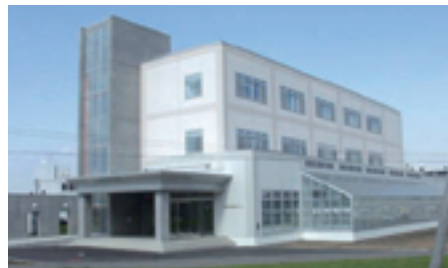
寒地農業生物機能開発センター

北海道の気候環境や生物機能を活用したクリーンな寒地農業の実現に向けて、作物・土壌微生物間相互利用の研究や作物の低温耐性・機能性強化研究等を加速するための設備が整っており、これまでに、「複合環境ストレス耐性イネの作出」「ダイズの遺伝子組換え技術の開発と種子成分改良への利用」等の研究成果を挙げました。