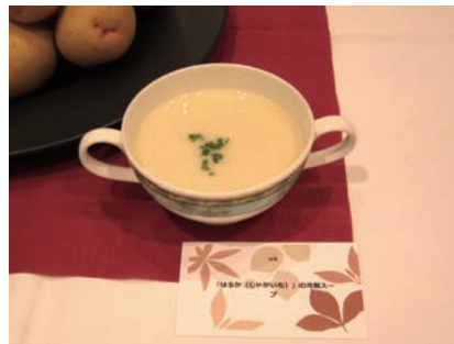
「はるか」の冷製スープ