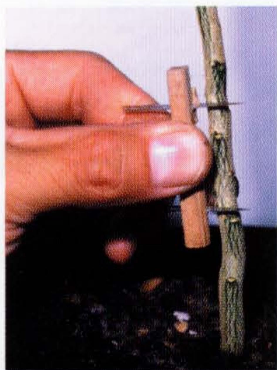
図3 皮接ぎ状況1 幹に3cm幅で傷をつけ樹皮をはがす