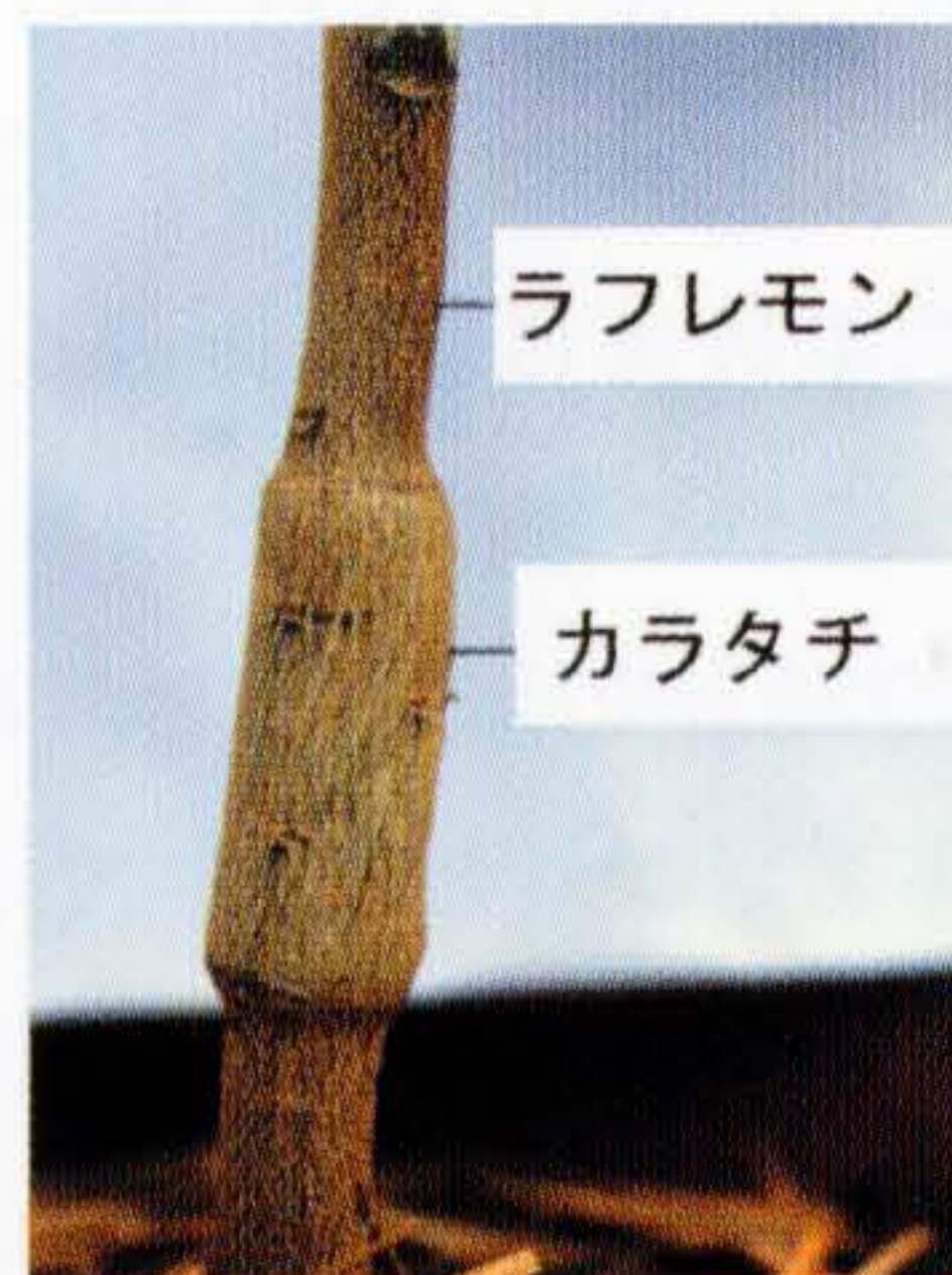
図5 強勢台木のラフレモンに半わい性台木のカラタチを皮接ぎしたもの