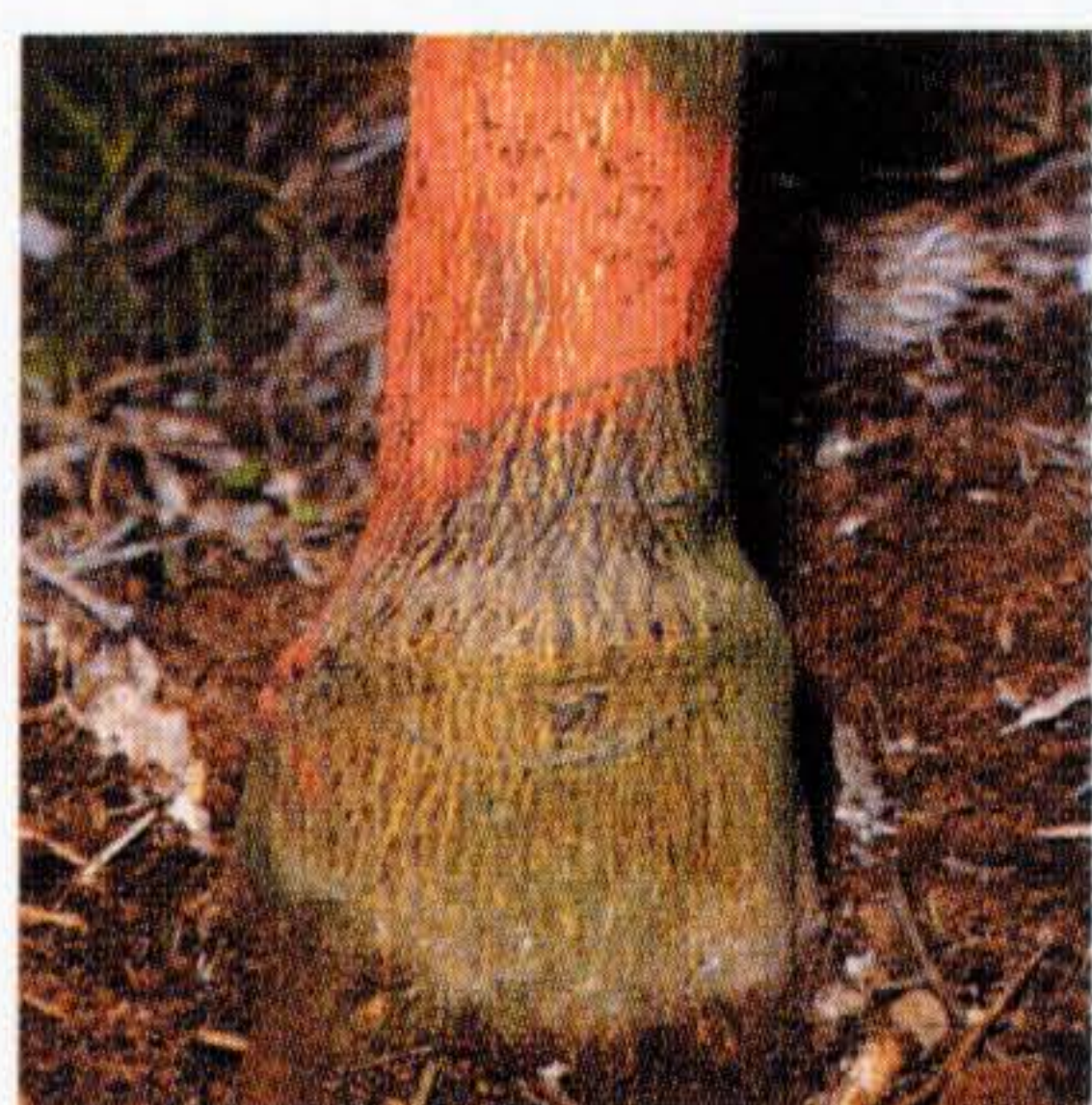
図1 わい性台木の台勝ち現象

なぜこのような肥大の差が生じるのかについては今のところ不明である。台勝ち、台負けのような接ぎ木部の段差は養分の移行阻害でも生じるが、図5、6のように皮接ぎ部分だけ太さが異なっているのは別の原因と考えられる。幹の肥大にはエチレンなどの植物生長調節物質が関与するが詳細なメカニズムは不明であるため、枝の肥大メカニズム解明への利用など植物生理学的にも利用できる興味深い現象である。