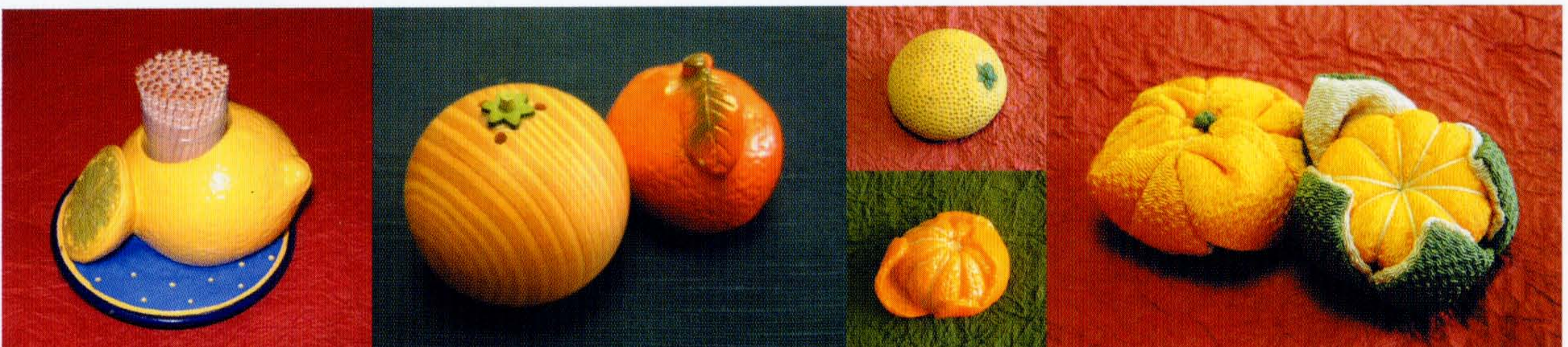
楊枝入、胡椒入&amp;鉛筆削り、マグネット(上下とも)、針刺