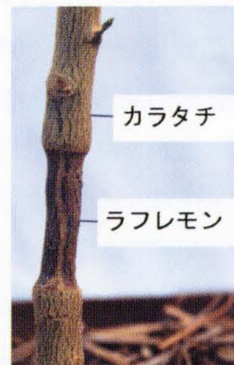
図6 半わい性台木のカラタチに強勢台木のラフレモンを皮接ぎしたもの