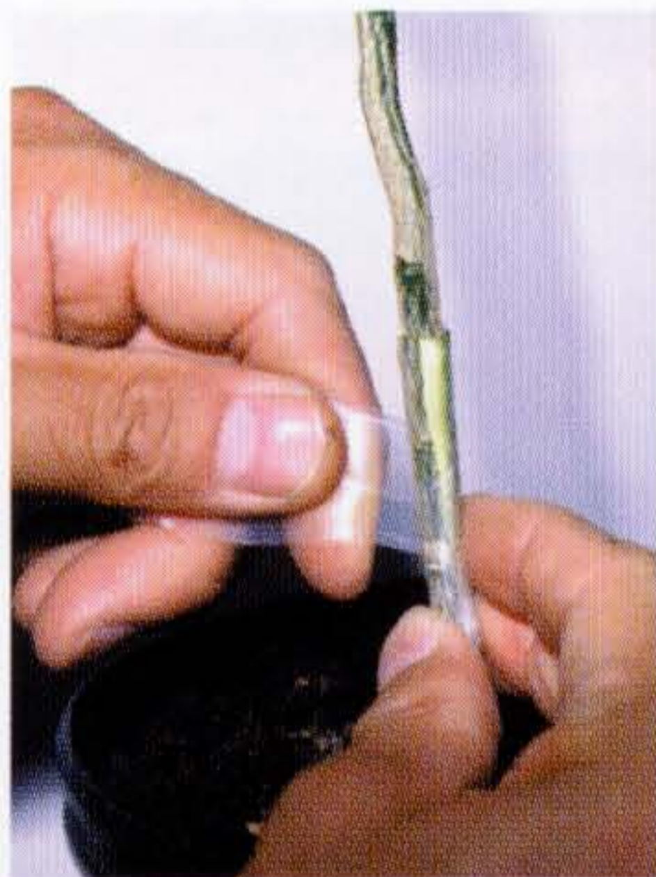
図4 皮接ぎ状況2 別の品種から同様に剥いだ皮を取りつけ、テープで固定する。約1週間で活着する。