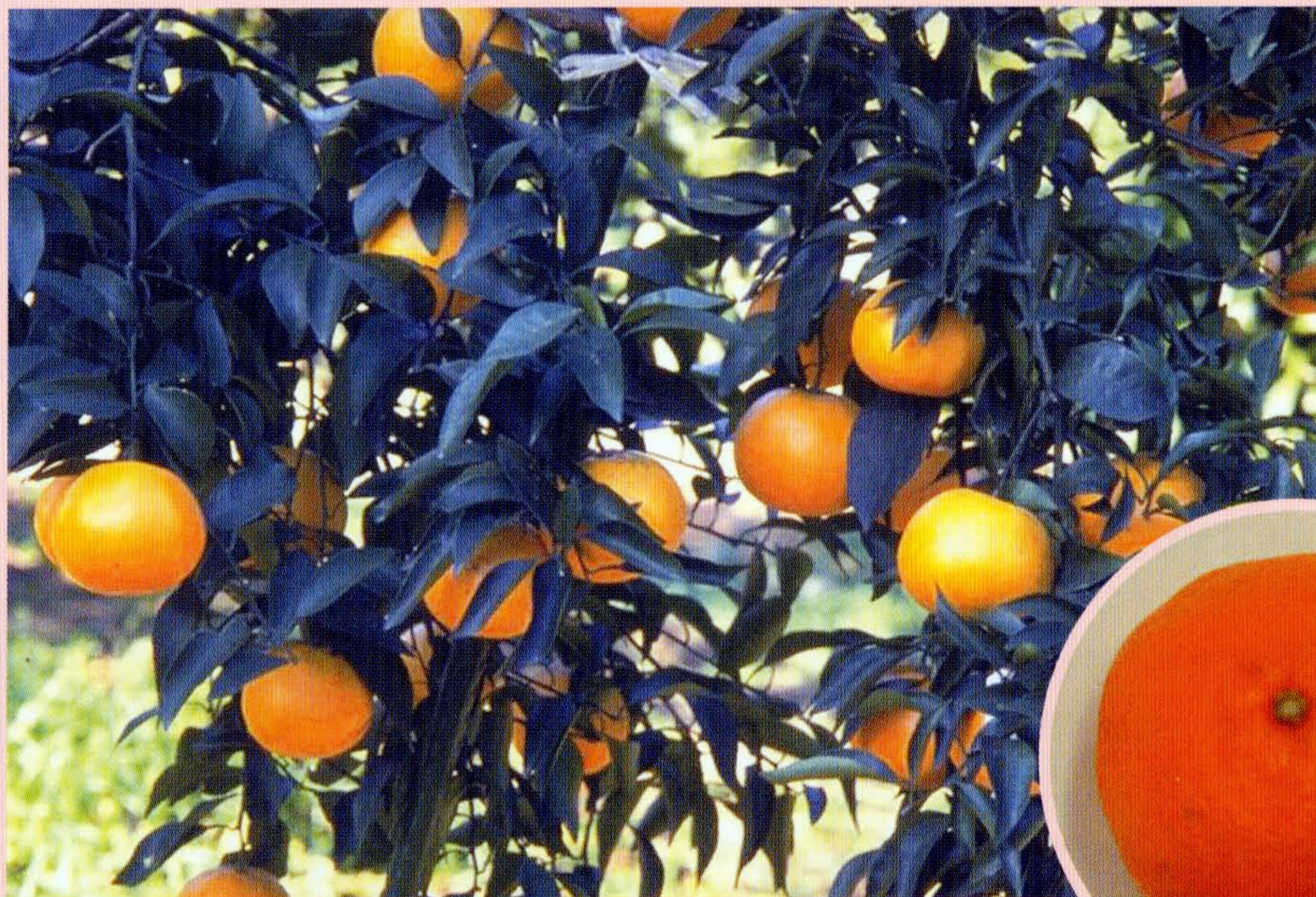
カンキツ「はるみの樹勢」と「果実」