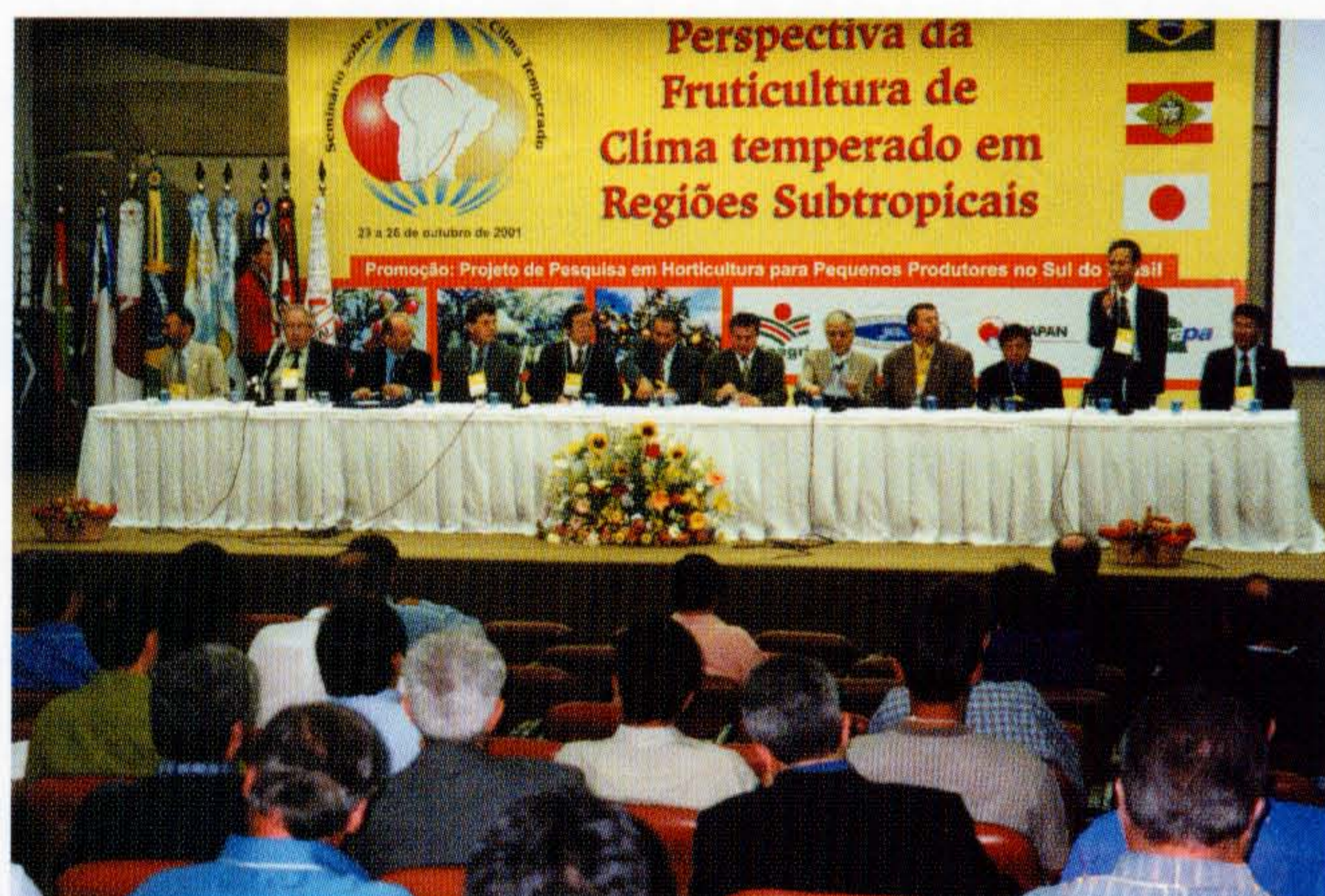
写真2 プロジェクト主催で開かれた温帯果樹セミナー

一方、ニホンナシについては栽培技術の指導により生産は安定し、また、高値で取引されることから、ニホンナシの栽培を始めるブラジル人も増加し、ブラジル人の生産者数は日系生産者を上回るほどになった。今後、ニホンナシの栽培が順調に伸びていくかどうかは、栽培技術の確立・普及指導とともに、今シーズンのような異常気象の起きる頻度が大きな要因になると考えられ、これを克服する対策の確立が課題である。帰国前の昨秋開催した温帯果樹セミナーはブラジルの国・州政府関係者ととともに、多くの研究者、そして生産者が参加し、大盛況であった(写真2)。日系移民にはブラジルでのニホンナシ栽培にかける強い執念が感じられる。