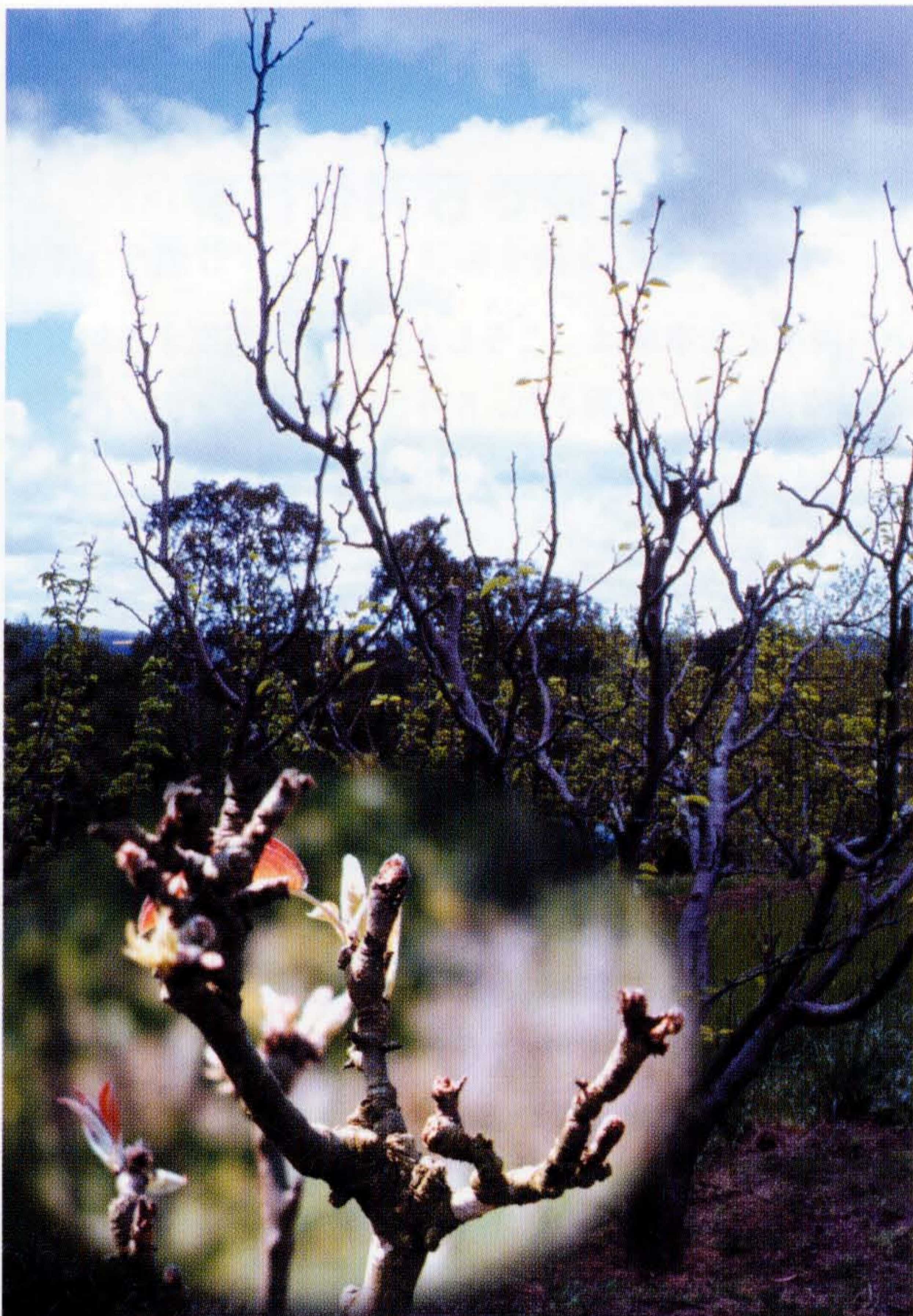
写真1 ニホンナシ(品種：二十世紀)の芽ぼけの状況

私共がかかわったブラジルでのリンゴとニホンナシに関する技術協力は1996年12月にスタートし、5年計画で昨年11月に終了した。リンゴについては、本プロジェクト以前の個別専門家派遣を含め25年間技術協力が続けられたが、ブラジルにおけるこれまでの技術協力を振り返ってみたい。