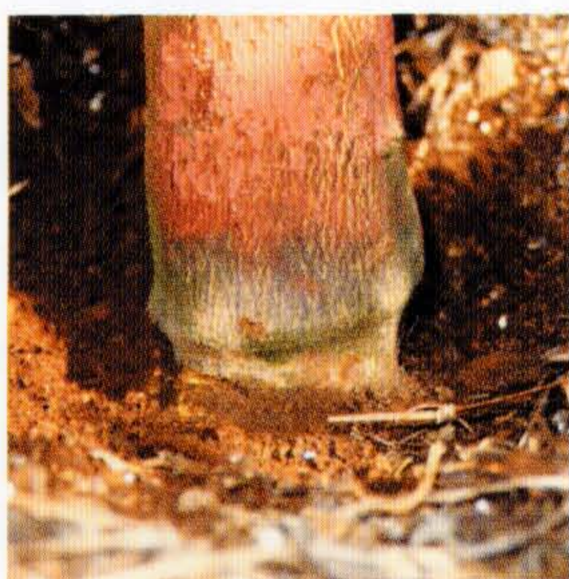
図2 強勢台木の台負け現象