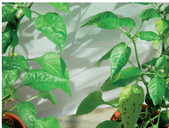
第3図 甘草抽出精製物の噴霧・風乾後にピーマン斑点病菌を接種した場合の発病状況 左：甘草抽出精製物 (1%) 噴霧 右：無処理 (蒸留水噴霧のみ)

第6表に結果をまとめた。試験1では甘草抽出精製物0.1%液および1%液を下葉に塗布した区で上位