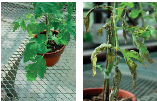
第2図 甘草抽出精製物とトマト褐色輪紋病菌を接種時に混合して噴霧接種した場合の発病状況 左：甘草抽出精製物(最終濃度1%)と接種時混合 右：対照

た病斑数を100とした対照比(以下、対照比)で見ると、甘草抽出精製物ではキュウリ炭疽病で0、トマト褐色輪紋病で1.9、ピーマン斑点病で3.7、キュウリ褐斑病菌で17.6に減少し、高い発病抑制効果を示した。一方、甘草熱水抽出物でも病斑数の減少が認められたが、その抑制効果は甘草抽出精製物に劣った。