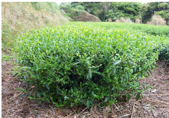
図1 「しゅんたろう」一番茶の園相

茶では早期に収穫したもののほど有利に取引される傾向があり、種子島などの暖地ではその気候的な優位性をいかすため、「くりたわせ」などの極早生品種の栽培が盛んです。一方で、「くりたわせ」は樹齢が古くなっていることや収量が少ないことなどから、有望な極早生品種の育成が望まれていました。そこで、そのような極早生品種栽培地域において優位性が発揮できる、多収で栽培しやすい茶品種の育成に取り組みました。