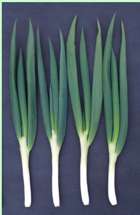
ネギ新品種「ふゆわらべ」の収穫物 (3ページに関連記事)