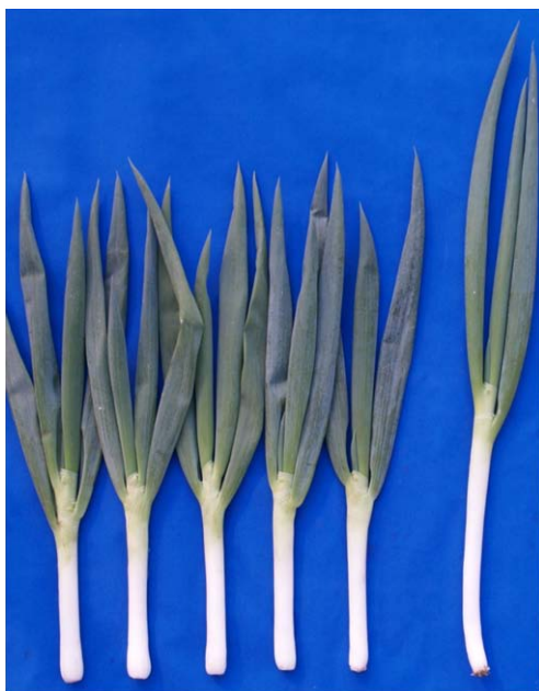
図1 「ふゆわらべ」収穫物の形状(右端は一般的な根深ネギ品種)

短葉の下仁田系品種と辛味が少なくやわらかい九条系品種が自然交雑した系統と根深ネギ品種から選抜した比較的短葉の系統を交配し、その後代から選抜を繰り返して育成した固定品種です(図1)。