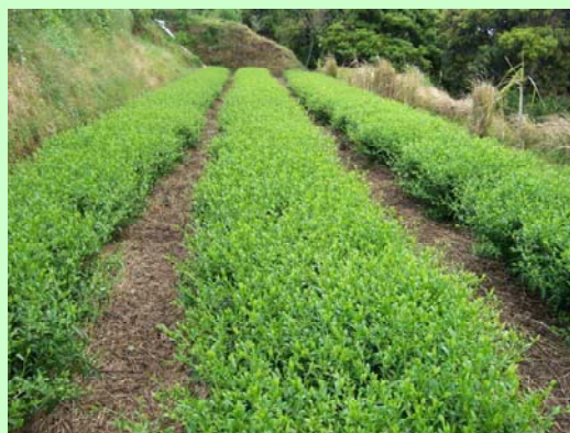
上写真チャ新品種「しゅんたろう」の新芽 下写真チャ新品種「しゅんたろう」の現地圃場 (4ページに関連記事)