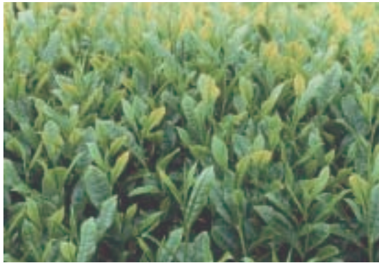
図-2 ‘そうふう’一番茶新芽