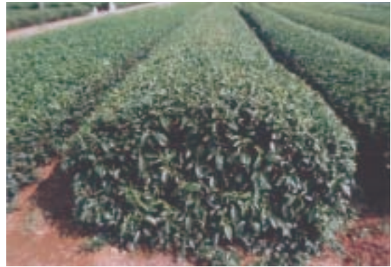
図-3 ‘そうふう’成園の生育状況